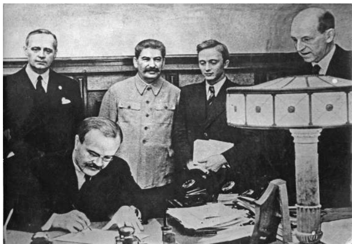
Подписание пакта Молотовым и Риббентропом

Небольшой приграничный город Белосток. Апрель 1941-го. Прошло уже почти два года с того самого дня, как немцы оккупировали Польшу, и потому тревога не покидает улочки городка. Люди запасаются мукой, солью, керосином. И готовятся к военному времени. Народ ничего не понимает в больших политических играх Советского Союза и Германии, но по вечерам все слушают новости из Москвы.