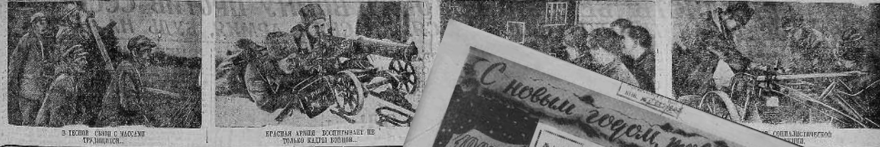
В ТВОЕЙ СМЕРТИ С УДАРОМ ТРУДЯЩИХСЯ...

ПРИВЕТ КРАСНОЙ АРМИИ—ВООРУЖЕННОМУ ОТРЯДУ МИРОВОЙ РЕВОЛЮЦИИ, СЛАВНОЙ БОЕВОЙ ЗАЩИТНИЦЕ СССР!