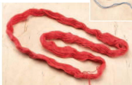
Пасма не перекрученная

Пасмы часто называют мотками , но это не одно и то же. В моток нить скручивают так, как в клубок, только в форме овала. Как и в клубках, нить в мотках готова к вязанию, и в большинстве случаев конец легко достается из середины.