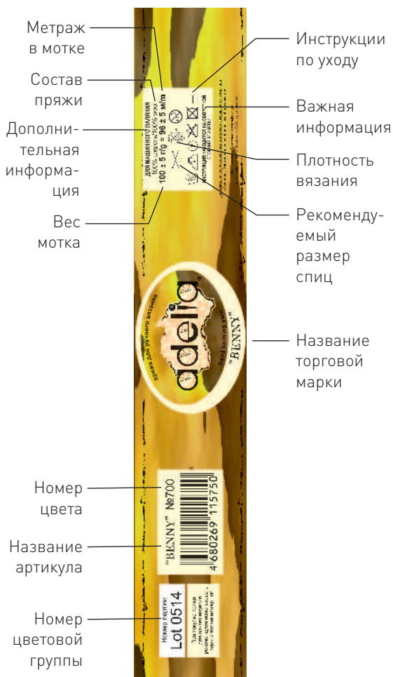
Этикетка пряжи Adelia Benny