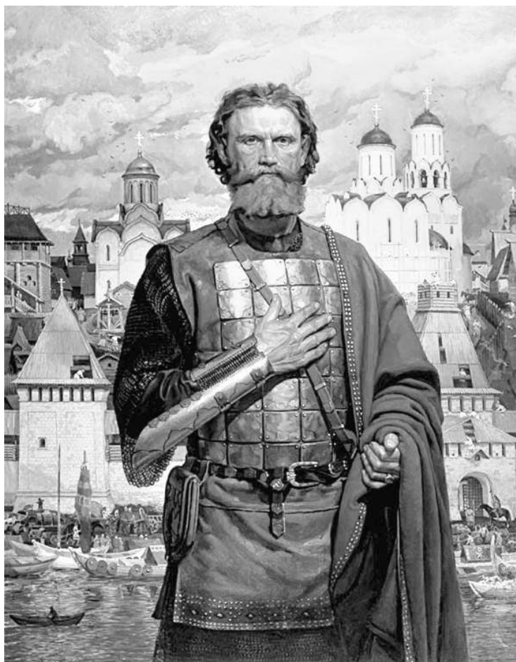
Дмитрий Донской. Художник В. Маторин