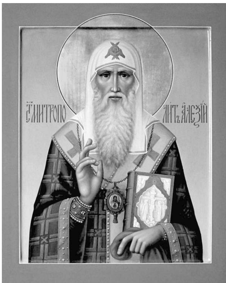
Св. Алексей митрополит Московский и всея России чудотворец