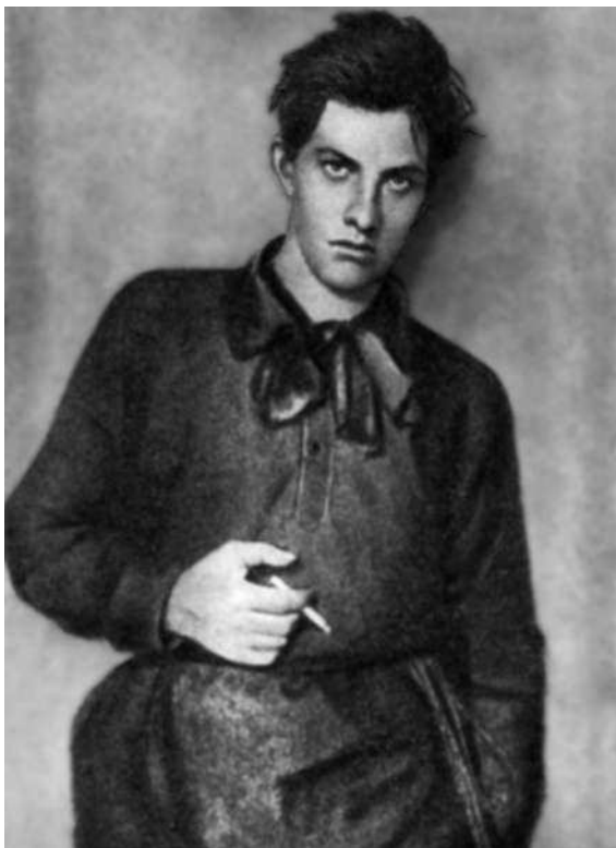
В. Маяковский — ученик Строгановского Училища. Москва, 1910 г.