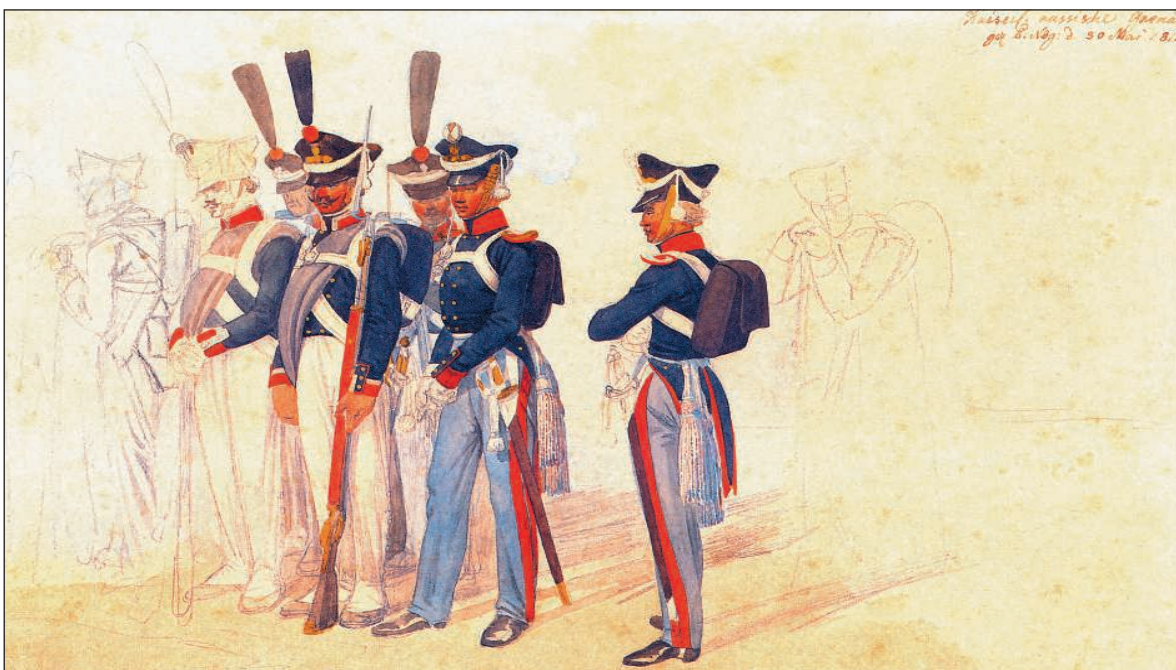
Гренадеры, унтер-офицер и обер-офицеры гренадерской роты. И.А. Клейн. 1815 г. Городской исторический музей г. Нюрнберга. Германия.

Практически все полки полевой пехоты имели общую структуру: полк делился на 3 батальона, батальон — на 4 роты. С 12 октября 1810 г. три батальона полка получили единообразную организацию: каждый батальон теперь состоял из одной гренадерской роты и трех рот, называемых во Франции «центральными» (в гренадерских полках это были фузилерные роты, в пехотных — мушкетерские, в егерских — егерские). В строю батальона взводы гренадерской роты — гренадерский и стрелковый — вставали на флангах, три остальные роты размещались между ними. Первый и третий батальоны считались действующими, а второй — запасным (в поход выступала только его гренадерская рота, а три остальные, выслав