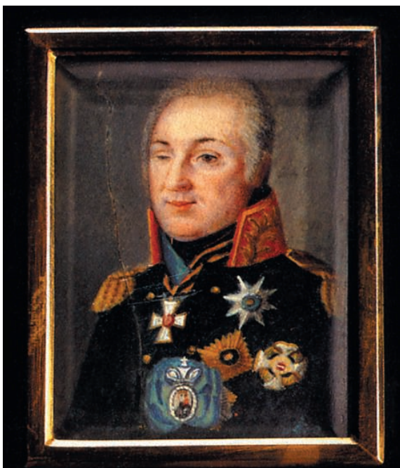
М.И. Кутузов. Миниатюра по гравюре Ф. Боллингера с оригинала Г. Розентреттера. 1-я четверть XIX в.

гие линейные полки превзошли основы егерского учения.