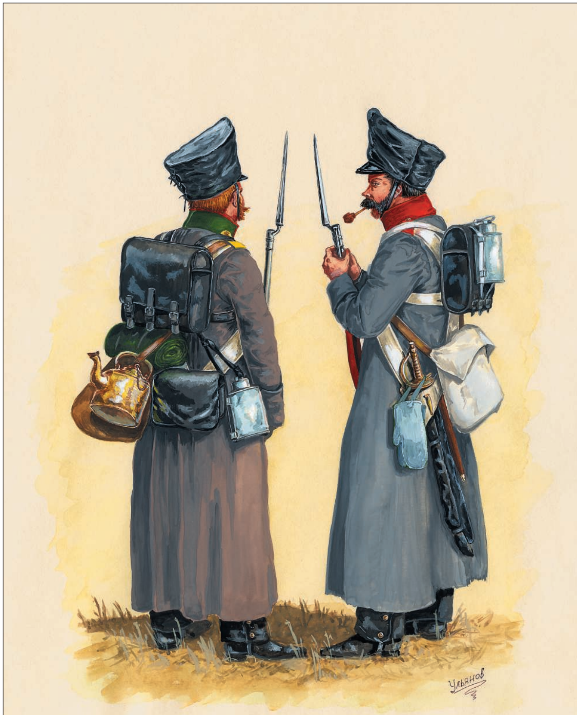
Гренадер линейной пехоты. Солдат первого по старшинству егерского полка дивизии. Кивер и патронная сума закрыты клеенчатыми чехлами. У солдата зачехлены кивер и ножны тесака (к которым также подвязан чехол с султаном). С тесака снят темляк, а на ручку повешены рукавицы шинельного сукна.