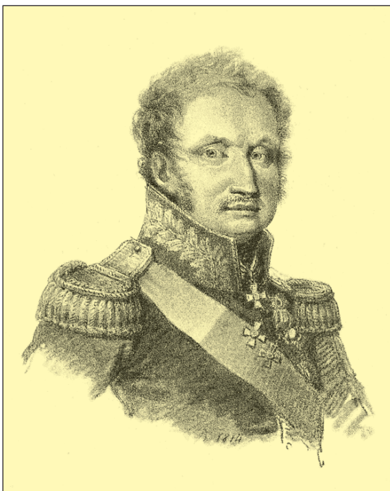
Князь П.Х. Витгенштейн. Рисунок Луи де Сент-Обена. 1812–15 гг.

ка. Сводные батальоны не формировались в приграничных (6, 19, 20, 21, 25-я) и в воевавших с Турцией (8, 10, 13, 16, 22-я) дивизиях.