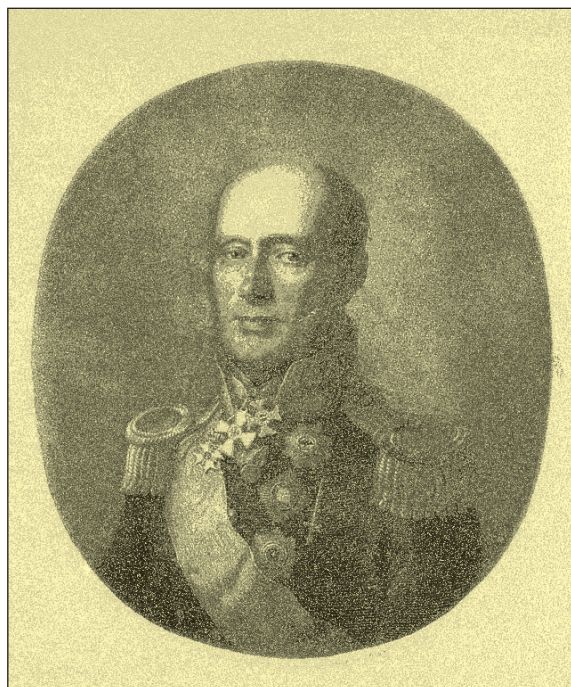
М.Б. Барклай де Толли

Армейская полевая пехота к началу войны состояла из 14 гренадерских, 96 пехотных, 4 морских, 50 егерских полков и Каспийского морского батальона. В 1811 г. было утверждено расписание дивизий, от 1-й до 27-й, и бригад; при этом 19-я и 20-я дивизии не имели постоянного бригадного разделения. По этому расписанию две гренадерские дивизии (1-я и 2-я) состояли из трех гренадерских бригад каждая, пехотные дивизии — из двух пехотных и одной егерской бригады (пехотные — первая и вторая бригады, егерская — третья). В 6-й дивизии вторая и третья бригады включали в себя по