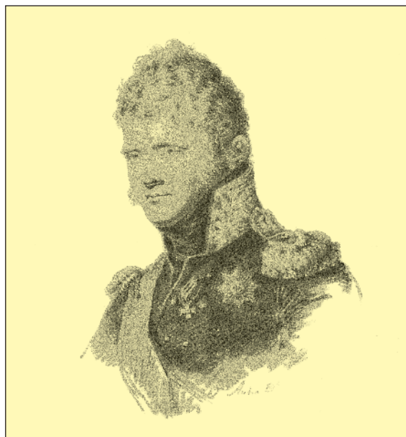
Император Александр I Рисунок Луи де Сент-Обена. 1812–15 гг.

тельно низкорослых и подвижных солдат. В целом к 1812 г. функциональные особенности видов пехоты в известной степени нивелировались: если егерские части изначально изучали правила сомкнутого строя, то и мно-