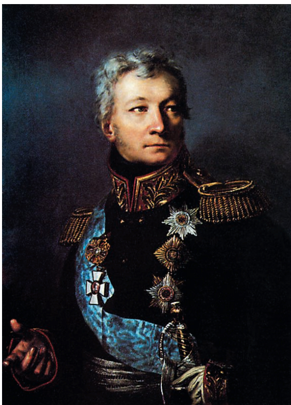
Генерал от кавалерии, граф А.П. Торшов

34-го полка — в 4-й, 36-го полка — в 11-й, 40-го полка — в 19-й, 41-го полка — в 6-й, 42-го полка — в 5-й, 50-го полка — в 49-й. При этом ряд оставшихся полков были рассчитаны на 3 батальона. В конце ноября такая же процедура последовала и в отношении линейной пехоты. В распоряжении М.И.Кутузова говорилось: «В каждой пехотной дивизии из 4 пехотных полков один слабейший обратить на укомплектование остальных полков той же дивизии, то есть 3 пехотных и 1-го (одного. — И.У.) Егерского» [149, с. 200].