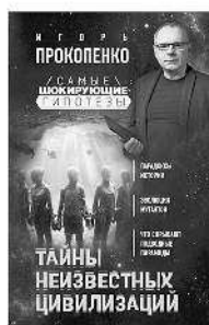
ТАЙНЫ НЕИЗВЕСТНЫХ ЦИВИЛИЗАЦИЙ