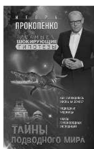
ТАЙНЫ ПОДВОДНОГО МИРА