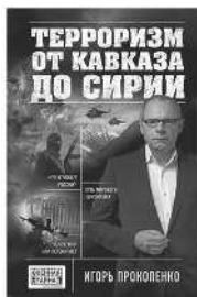
ТЕРРОРИЗМ ОТ КАВКАЗА ДО СИРИИ