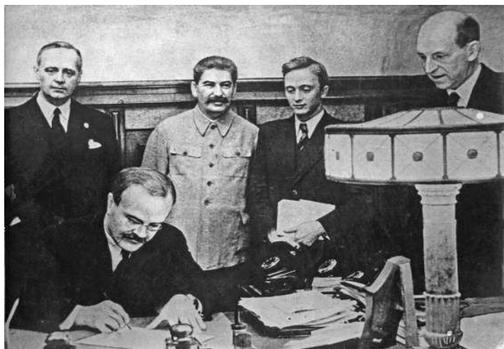
Подписание пакта Молотовым и Риббентропом

Небольшой приграничный город Белосток. Апрель 1941-го. Прошло уже почти два года с того самого дня, как немцы оккупировали Польшу, и потому тревога не покидает улочки городка. Люди запасаются мукой, солью, керосином. И готовятся к военному времени. Народ ничего не понимает в больших политических играх Советского Союза и Германии, но по вечерам все слушают новости из Москвы.