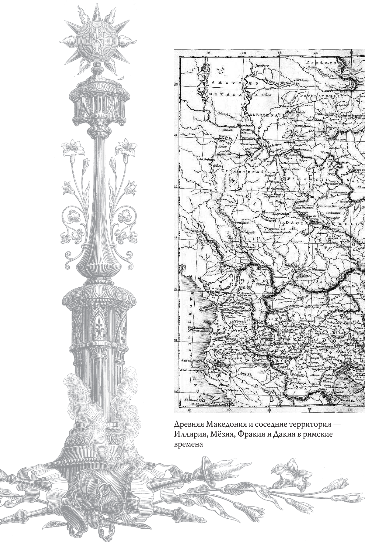
Древняя Македония и соседние территории — Иллирия, Мёзия, Фракия и Дакция в римские времена