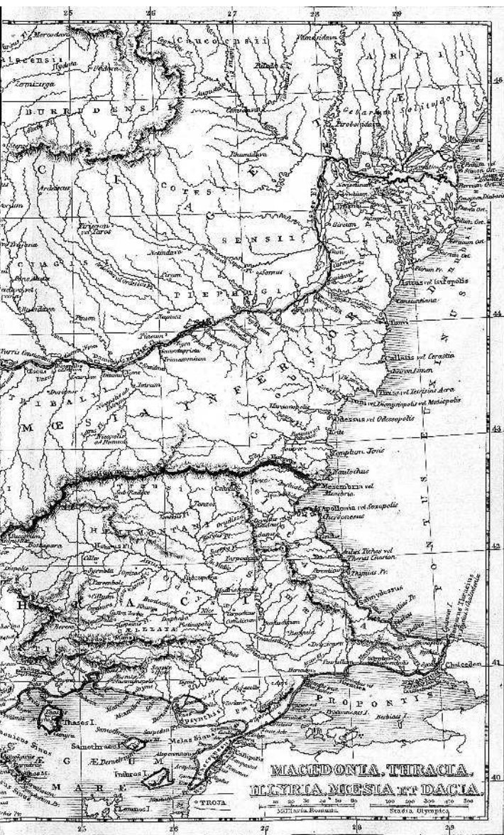
Карта из атласа Alexander G. Findlay. Classical Atlas to Illustrate Ancient Geography. 1849 г.