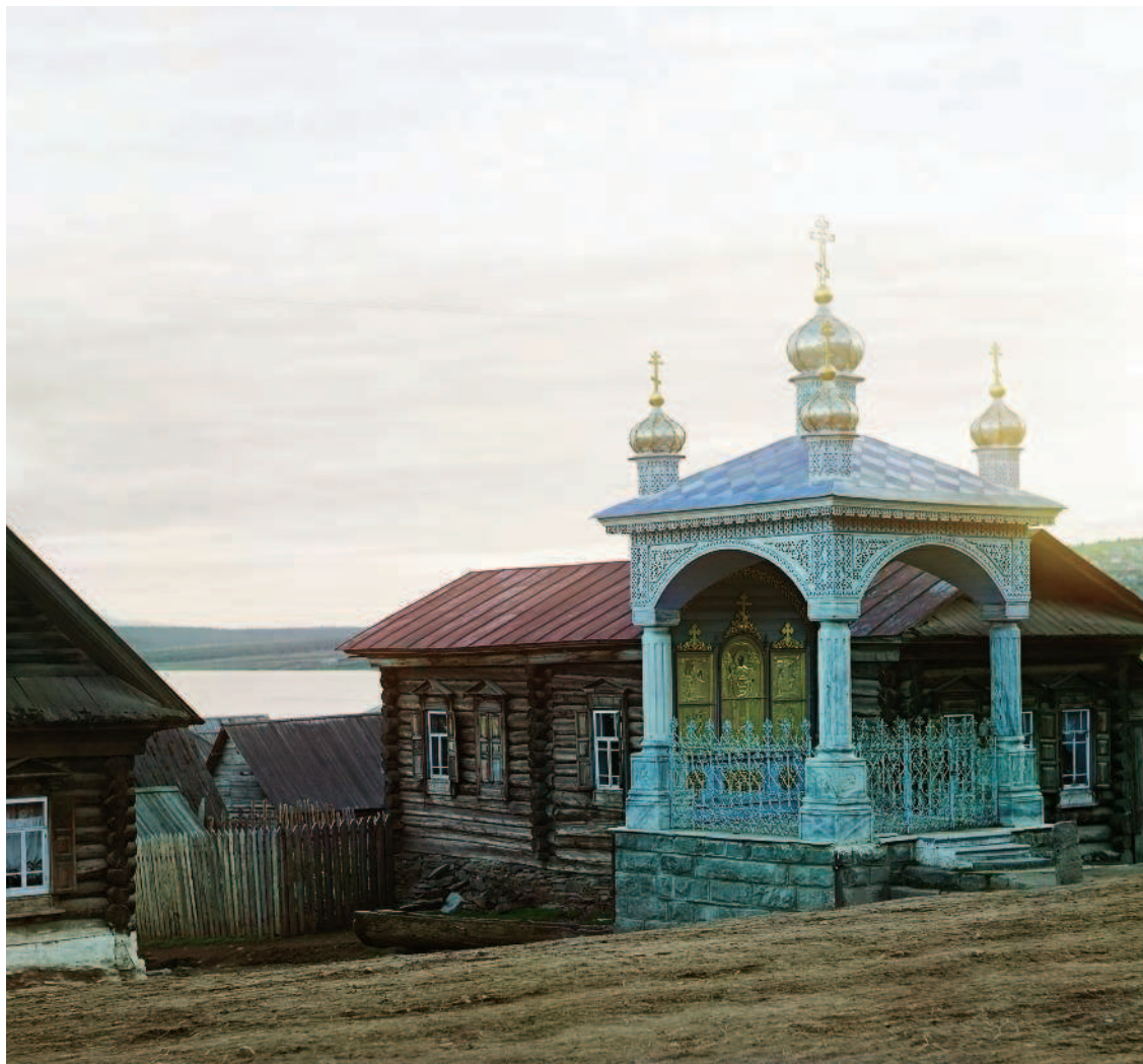
Часовня во имя Николая Чудотворца в селении Ветлуга. Город Златоуст.