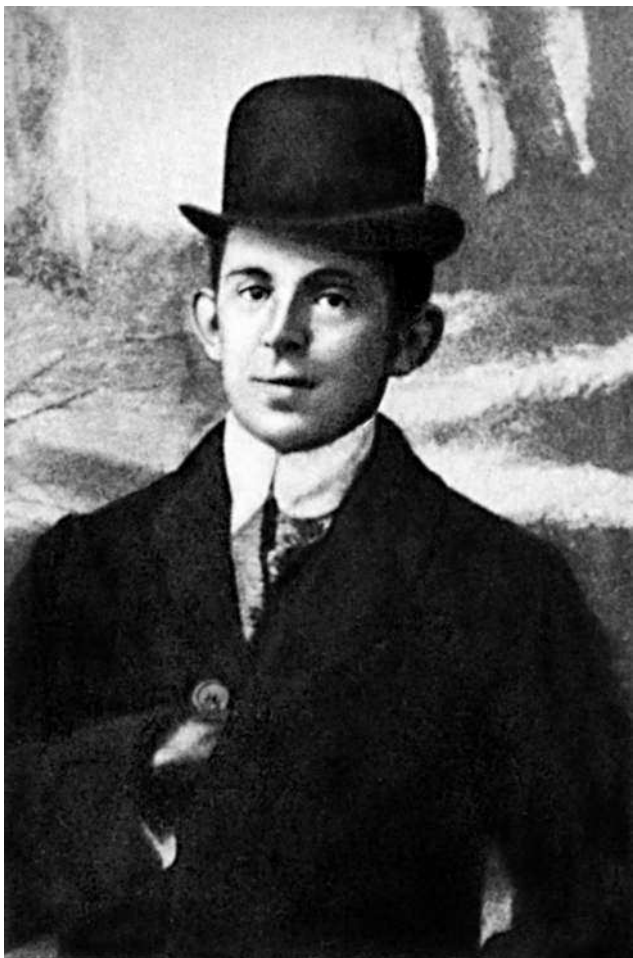
Осип Мандельштам. 1909 (?) г.