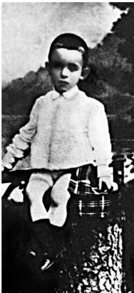
Ося Мандельштам. 90-е годы