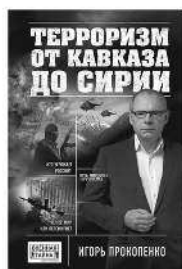
ТЕРРОРИЗМ ОТ КАВКАЗА ДО СИРИИ