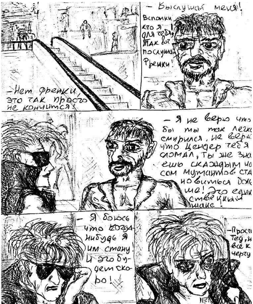
Рисунок М. Горшенева.

Горшок нашел в 40 минутах ходьбы от дома подростковый клуб. Этот клуб не относился к нашему району, но в нем была какая-никакая аппаратура, был музыкальный руководитель, и нас (о, да!) пустили туда раз или два в неделю играть. Там были барабаны, электрогитара, бас и микрофоны! Первым делом музруководитель, молодой такой и прикольный парень, спросил: «Кто умеет