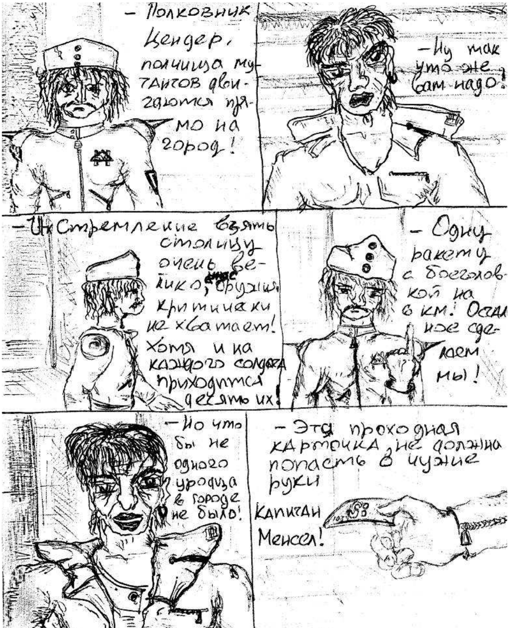
Рисунок М. Горшенева.

играть на гитаре?» Горшок поднял руку. И стал гитаристом (к нему домой уже четыре раза приходил учитель гитары). «А кто хочет научиться?» — спросил музрук. И я взял в руки бас-гитару. Так что Поручику остались барабаны.