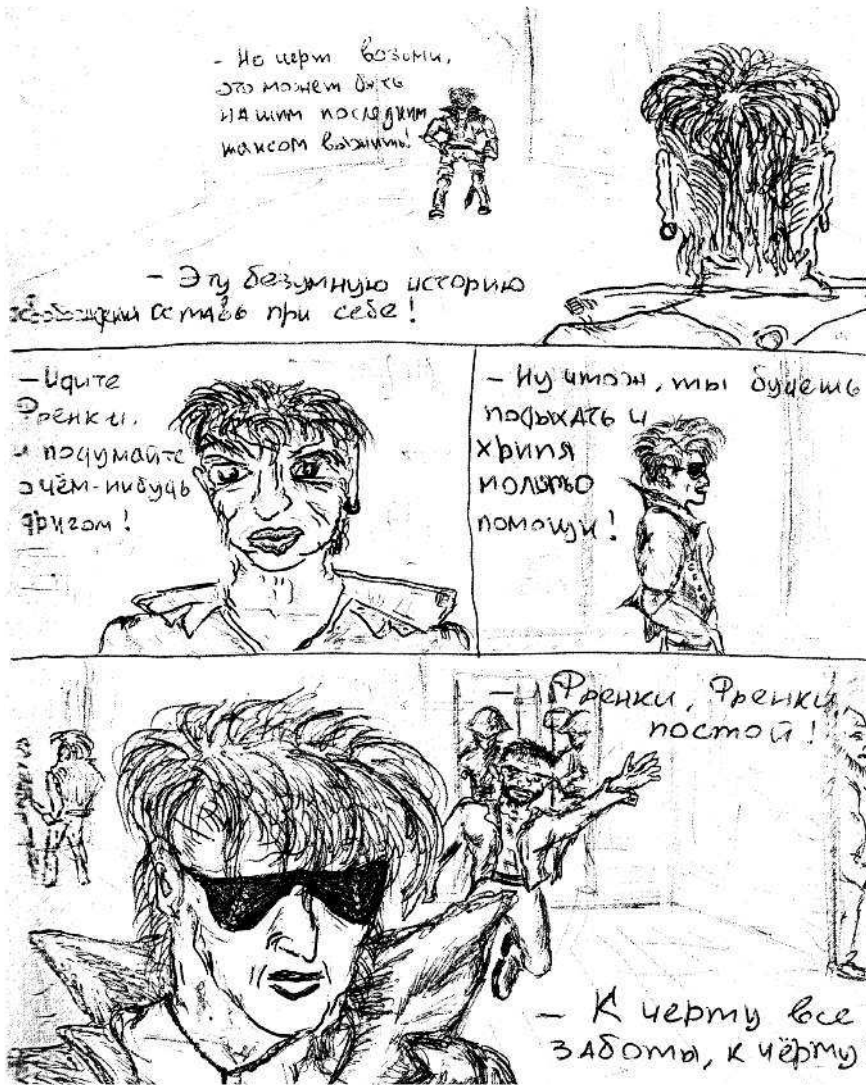
Рисунок М. Горшенева.

Идея мне сразу понравилась, я согласился, и мы принялись рассуждать, что будем делать и кого в группу возьмем еще. Кстати, идея понравилась многим моим одноклассникам, но вступать в группу никто так и не захотел.