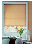
le store штора