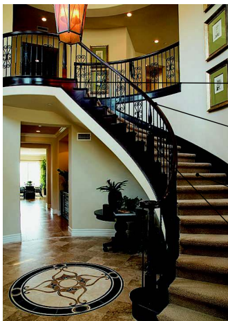
le palier d'escalier лестничная площадка