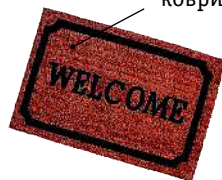
le tapis-brosse коврик