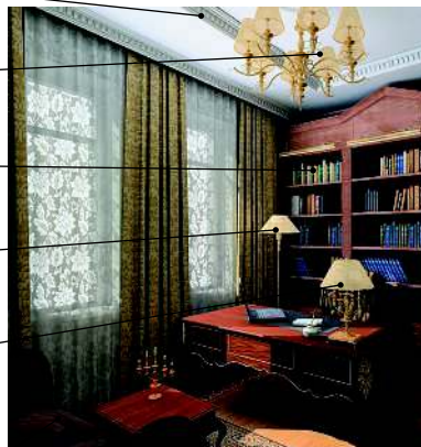
le bureau кабинет