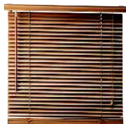
le store vénitien жалюзи