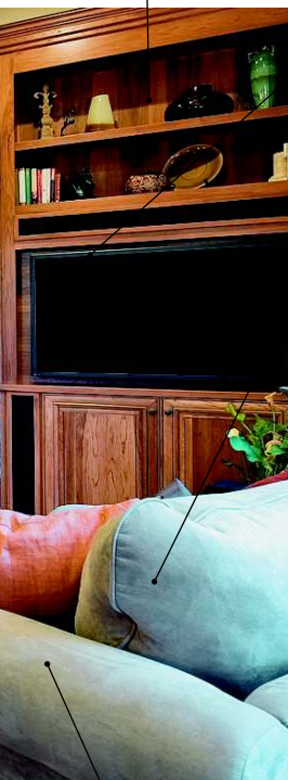
le vaisselier сервант