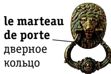
le marteau de porte дверное кольцо