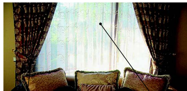
le rideau портьера