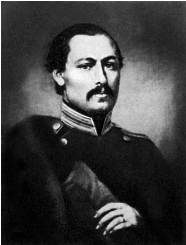
А. А. Фет. Портрет работы неизвестного художника. 1840-е гг.