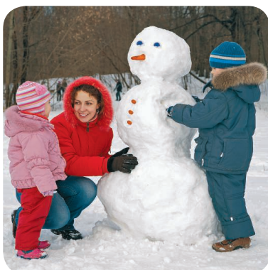
make a snowman