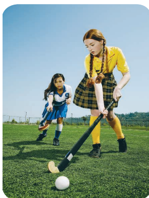
play field hockey