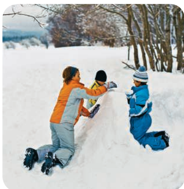
build a snow fortress ['fɔ:trəs]