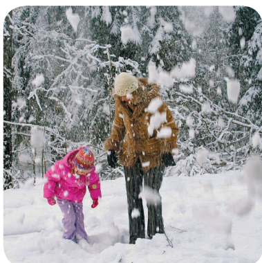
take a walk in the winter forest