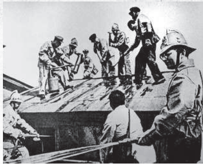
Композитор Дмитрий Шостакович (первый справа) в дни блокады Ленинграда во время Великой Отечественной войны был бойцом добровольной противопожарной команды и дежурил на крыше консерватории. 1941 г.

* Достигли высшего накала бои под Ленинградом в районе Вороньей горы. В этот день стоявшая там советская артиллерия отразила 10 атак танков и пехоты. Это была так называемая батарея «А», вооруженная 9 орудиями, снятыми с крейсера «Аврора» (отсюда и название); она состояла из 200 человек тоже, главным образом, моряков с «Авроры», а также артиллеристов Кронштадта и Ленинграда. В неравной схватке погибли