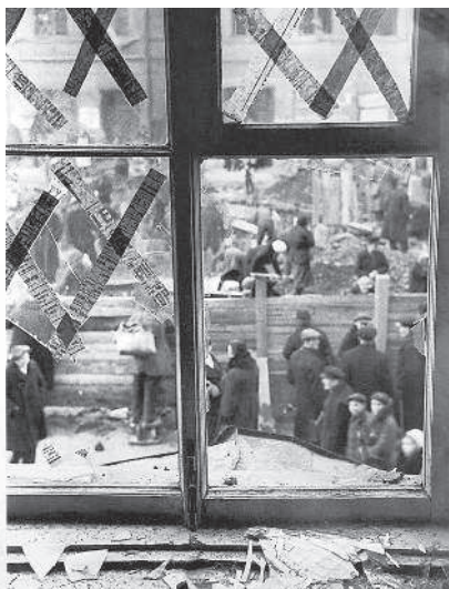
Окно Театра юного зрителя после немецкой бомбежки. 5 октября 1941 г.

подготовить план захвата Ленинграда не позднее сентября 1941 года. В беседах с военачальниками фюрер помимо чисто военных доводов привёл немало политических аргументов. Он полагал, что захват Ленинграда даст не только военный выигрыш (контроль над всеми балтийскими побережьями и уничтожение Балтийского флота), но и принесёт огромные политические дивиденды. Советский Союз потеряет город, который, являясь колыбелью Октябрьской революции, имеет для советского государства особый символический смысл. Кроме того, Гитлер считал очень важным не дать советскому командованию