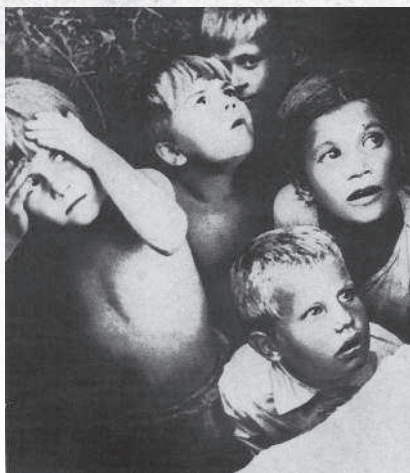
Дети, прячущиеся от бомбардировки. Лето 1941 г.

ния «Линии Сталина» в направлении на Остров. 9 июля был занят Псков (280 километров от Ленинграда). 19 июля, к моменту выхода передовых немецких частей, на Лужском оборонительном рубеже уже были построены оборонительные сооружения протяжённостью 175 километров и общей глубиной 10–15 километров. Днём и ночью работали здесь ленинградцы, в основном женщины и подростки.