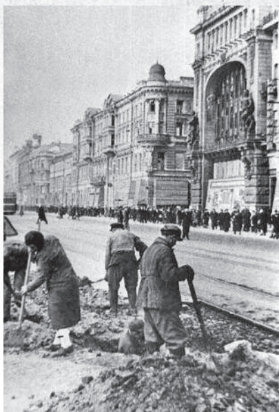
Невский проспект осенью 1941 г.

Во время этого налета произошел один из самых таинственных и трагических случаев за всю Ленинградскую блокаду: сгорели Бадаевские продуктовые склады. Советские историки уверяли, что сгорели они в результате налета: склады деревянные, располагались кучно. Однако в этом происшествии было несколько очень странных моментов. Все пожары в ту ночь были довольно быстро потушены — кроме Бадаевского: склады горели более 5 часов. Почему продукты, уже в условиях блокады, хранились так небрежно, почему не была усилена их пожарная часть? Пожарная охрана города насчитывала уже почти 12 тысяч человек (это помимо рядовых жителей, которые каждую ночь дежурили на крышах своих домов). Зато загоревшиеся Бадаевские склады сразу же были оцеплены войсками НКВД, которые выстрелами отгоняли ленинградцев, сбежавшихся наскрести хоть немного горелой муки. Далее, советские историки уверяли: версия о том, что пожар на Бадаевских складах был одной из главных причин голода,