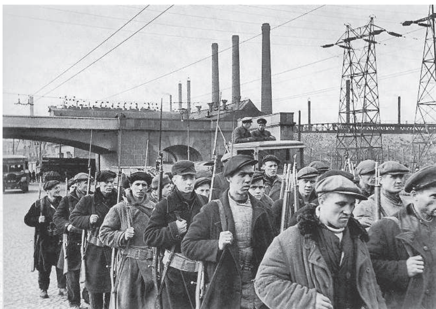
Рабочий отряд. 25 сентября 1941 г.

и оборонных объектов города, а также (с одобрения Сталина) план уничтожения кораблей Балтийского флота и судов торгового флота. Прилетевший в Ленинград 10 сентября Жуков прикажет отменить минирование кораблей. В 1950 году он вспомнит: “Как вообще можно минировать корабли? Да, возможно, они погибнут. Но если так, они должны погибнуть только в бою, стреляя. И когда потом немцы пошли в наступление на приморском участке фронта, моряки так дали по ним со своих кораблей, что они просто-напросто бежали. Еще бы! 16-дюймовые орудия! Представляете