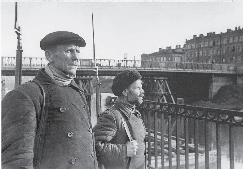
Патруль. 24 октября 1941 г.

Однако, по воспоминаниям очевидца, Ворошилов всего-навсего вышел из машины, поговорил с командиром подразделения, который, крутя ус, пообещал, что сейчас поднимет дивизию в бой. А дивизия эта — необстрелянная дивизия народного ополчения, состоявшая из пожилых или совсем молодых людей, с одной винтовкой на пятерых, под огнем противника лежала в окопах. Ворошилов мрачно заметил усатому командиру, что, видимо, только присутствие маршала подвигло его принять решение перейти в наступление. Английский журналист Александр Верт выскажет предположение, будто Ворошилов, осознавая свою