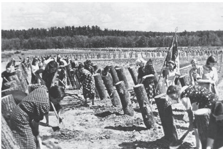
Строительство оборонительных сооружений. 1941 г.

4 июля части вермахта вступили в Ленинградскую область, форсировав реку Великая и преодолев укрепле-