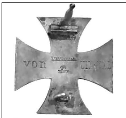
Аверс и реверс Железного креста 1-го класса образца 1870 года

Война была скоротечной, в нескольких сражениях французская армия была наголову разгромлена, и уже 28 января 1871 года заключено перемирие. Франция была повержена. Столь радостное событие (а кроме того, провозглашение 18 января 1871 года создания Германской империи во главе с королем Пруссии Вильгельмом I) было отмечено массовыми пожалованиями Железным крестом. Железный крест 2-го класса получили 43 250 человек, Железный крест 1-го класса – 1230. «Звезду