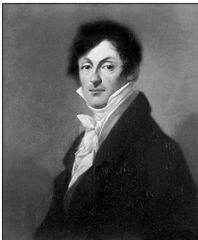
Александр Иванович Остерман-Толстой, кавалер Большого Кульмского креста

С началом Франко-прусской войны 1870 — 1871 годов прусский король Вильгельм I 19 июня 1870 года объявил о воссоздании Железного креста, все в тех же трех степенях. Цвет ленты и внешний вид ордена остались без изменений, имелись лишь небольшие отличия. Обратная сторона креста осталась без изменений. Лицевая же сторона была теперь оформлена