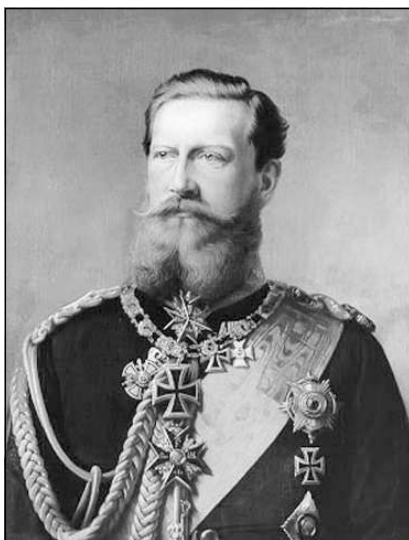
Король Пруссии Фридрих Вильгельм III Гогенцоллерн — основатель ордена Железного креста

Однако симпатии Пруссии были не на стороне Франции, и союз с ней был мерой вынужденной. Поэтому как только такая возможность представилась, Прус-