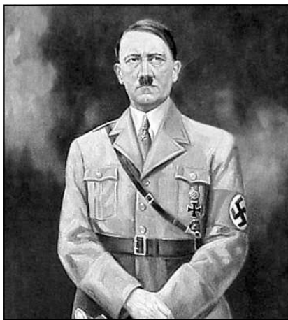
Уже став правителем Германии, Адольф Гитлер всегда носил на мундире Железный крест 1-го класса образца 1914 года

что ефрейтор Гитлер имел Железные кресты обоих классов.