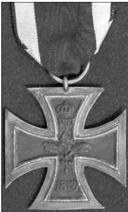
Железный крест 2-го класса образца 1813 года

Во нынешнее тяжелое время, когда решаются судьбы нашего Отечества, огром-