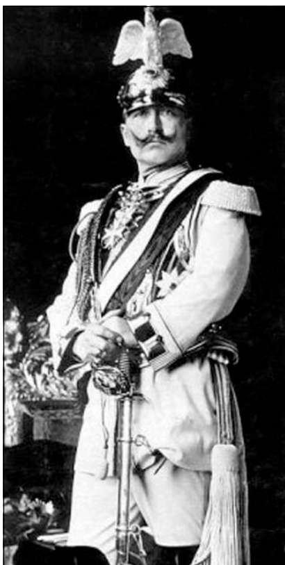
Последний император Германский и король Прусский Вильгельм II Гогенцоллерн

Награждение Большим крестом не обусловлено предыдущими награждениями