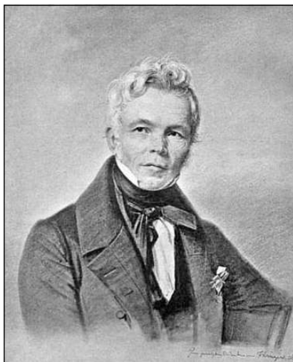
Художник Карл Фридрих Шинкель, автор эскиза Железного креста

ные (хотя и не пережившие крах Германской империи) ордена, как Черного орла, Красного орла и самый почетный — Pour le Mérite . Тем не менее король решил учредить «собственную» награду и даже, как говорят, самолично набросал эскиз будущего ордена. Однако этот эскиз оказался невостребованным. Дело в том, что дальнейшая разработка внешнего вида Железного креста была поручена известному прусскому архитектору и художнику Карлу Фридриху Шинкелю (Schinkel). Шинкель (родился 13 марта 1781 года в Нойруппине, Бранденбург; умер 9 октября 1841 года в Берлине) в 1799 — 1802 годах учился в Берлинской академии архитектуры и в 1811 году стал членом Академии изящных искусств. Позже — в 1815 году — после смерти Пауля Людвига Симонса он был пожалован званием тайного обербаурата (старшего строительного со-