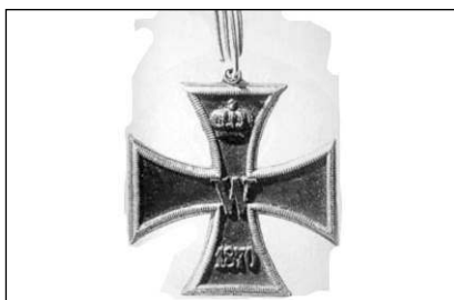
Большой крест Железного креста образца 1870 года

Блюхера» не получил никто, а вот кавалерами Большого креста Железного креста стало сразу девять человек: