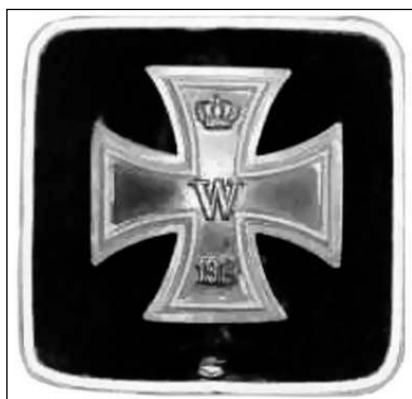
Железный крест 1-го класса образца 1914 года

высочайше утвержденной почетной надбавки, распространяются и на Железный крест 1-го и 2-го класса.