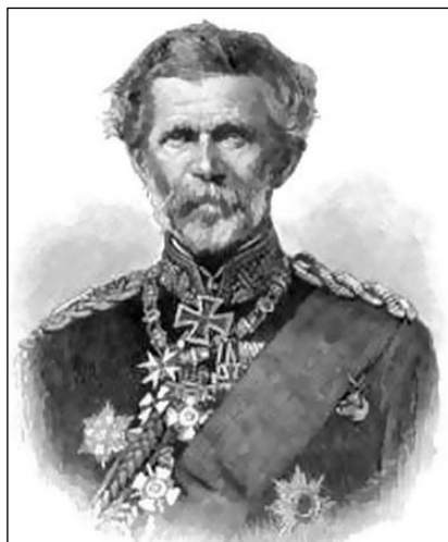
Кавалер Большого креста образца 1870 года генерал-фельдмаршал барон Эдвин фон Мантейфель

принц Прусский (22 марта 1871 года), младший брат короля Вильгельма I;