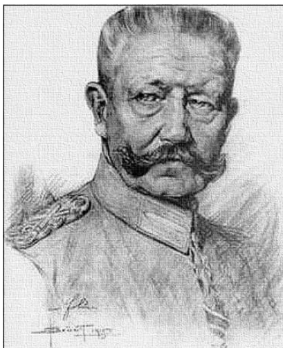
Генерал-фельдмаршал Пауль фон Гинденбург, второй после Блюхера — и последний — кавалер Большой звезды Железного креста

Во время Первой мировой войны состоялись и награждения женщин Железным