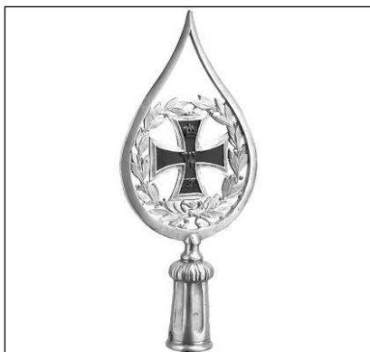
Почетное навершие знамени с Железным крестом

Война была скоротечной, в нескольких сражениях французская армия была наголову разгромлена, и уже 28 января 1871 года заключено перемирие. Франция была повержена. Столь радостное событие (а кроме того, провозглашение 18 января 1871 года создания Германской империи во главе с королем Пруссии Вильгельмом I) было отмечено массовыми пожалованиями Железным крестом. Железный крест 2-го класса получили 43 250 человек, Железный крест 1-го класса – 1230. «Звезду