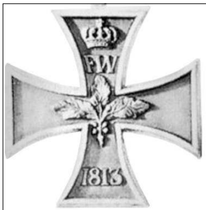
Большой крест Железного креста образца 1813 года

В соответствии с этим решением Мы предписываем следующее: