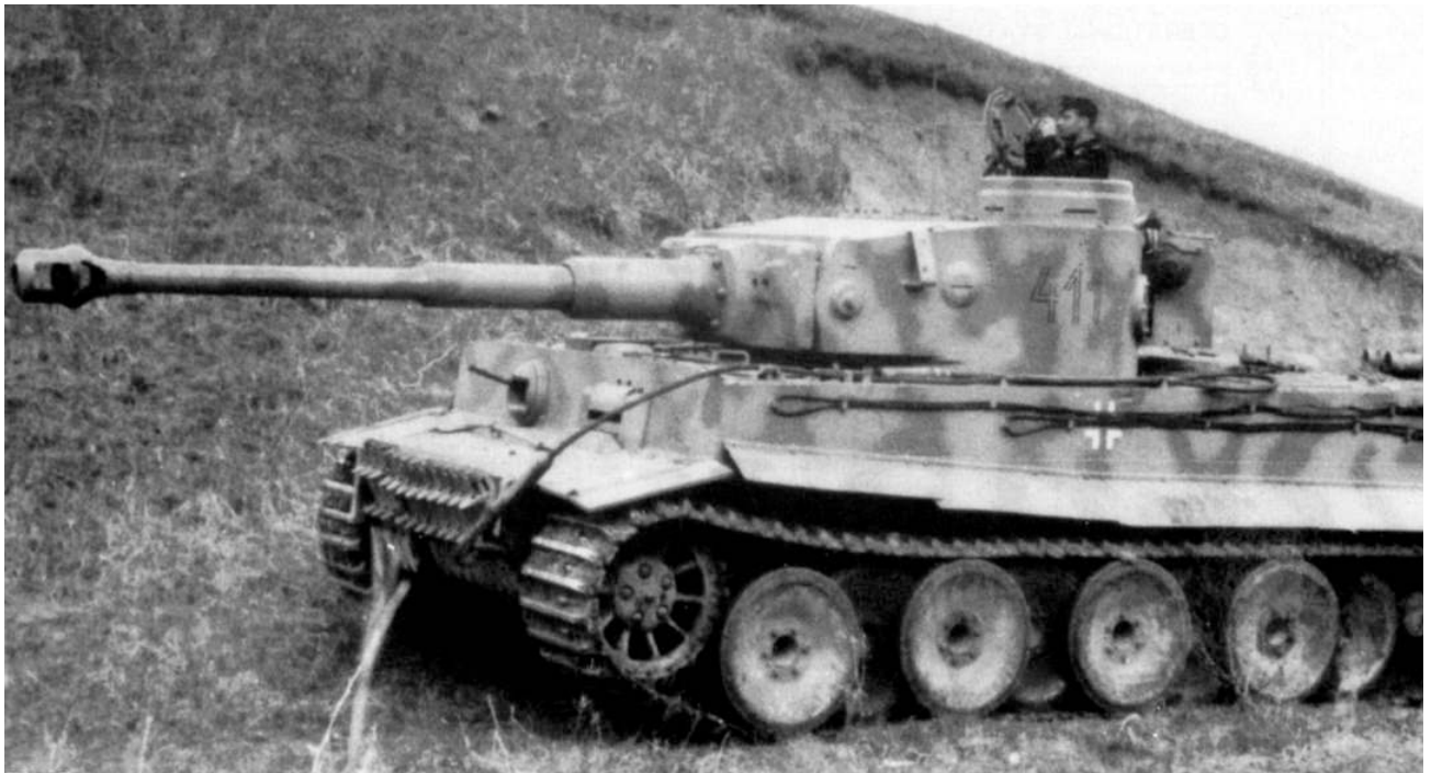
Танк «Тигр» роты тяжелых танков 1-й панцергренадерской дивизии СС «Лейбштандарт Адольф Гитлер». Район Белгорода, май 1943 года. Машина имеет башенный номер 411, хорошо виден двухцветный камуфляж, а также укладка троса на левом борту (ИП).