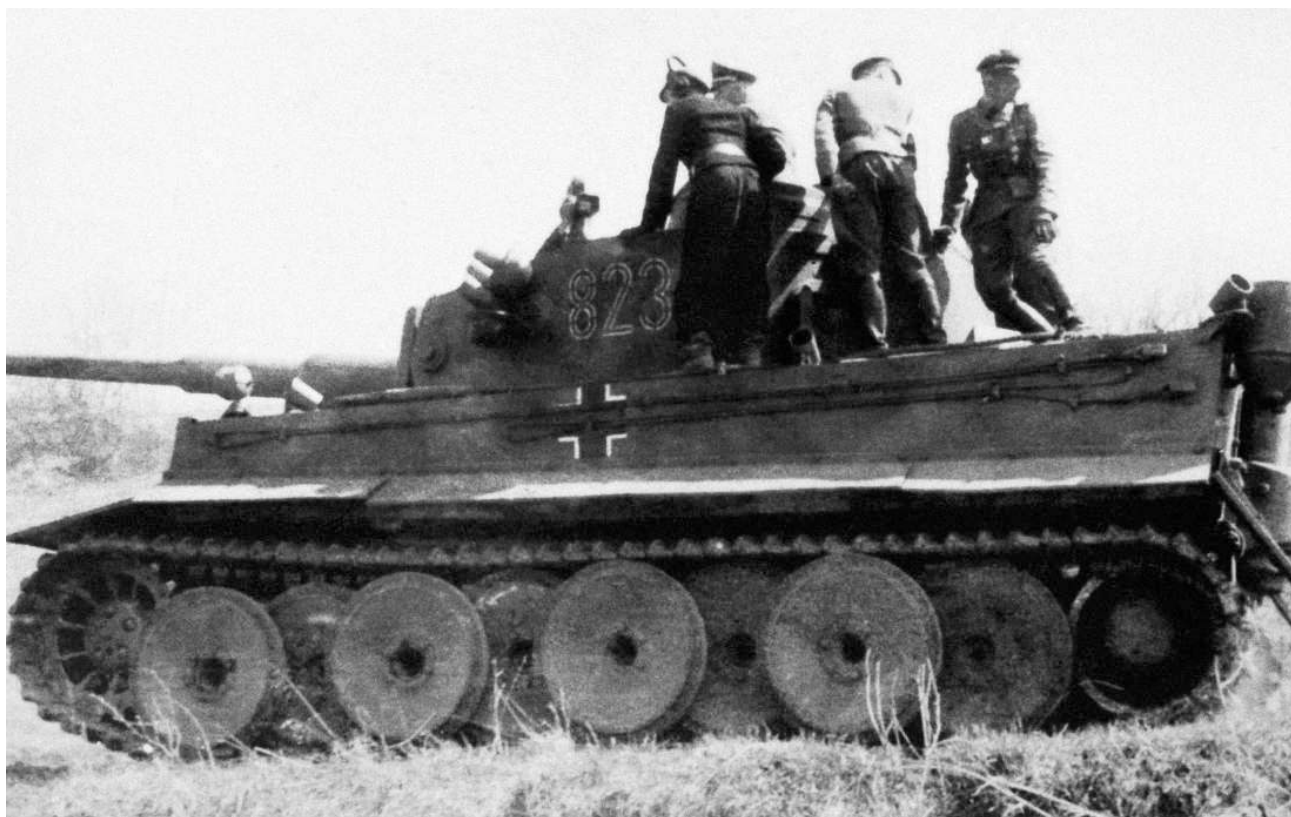
«Тигр» роты тяжелых танков 2-й панцергренадерской дивизии СС «Дас Райх» во время его демонстрации рейхсфюреру СС Г. Гиммлеру. 1 мая 1943 года. Машина имеет башенный номер 823 (БА).