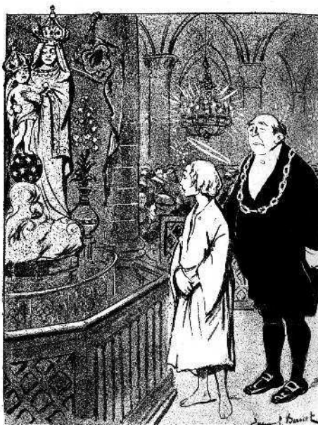
LE BIDEAU. — C'est la Sainte Vierge... JESUS. — Pauvre maman (Elle qui était si jolie)!

Даже в антиклерикальной карикатуре XIX–XX вв. фигура Христа могла использоваться и для атаки против христианства или религии в целом, и для того, чтобы показать, что конкретные Церкви давно о Христе позабыли. На одном из рисунков, вышедших в 1907 г. в пред рождественском номере французского сатирического журнала « Assiette au beurre », юный Иисус, стоя в церкви, обескураженно смотрит на разукрашенную статую Девы Марии и печально замечает: «Бедная мама, она ведь была такая красивая» (3). Это выпад против безвкусицы массового церковного искусства, благочестивого китча XIX в.: