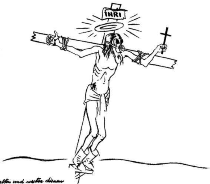
1. Георг Гросс. Распятие, 1927 г.

сумев доказать вины художника и его издателя, все же постановил конфисковать и уничтожить тираж рисунков. В январе 1933 г., незадолго до того, как Гитлер занял пост канцлера, художник, которого нацисты давно клеймили как большевика и врага отечества, был вынужден покинуть Германию.