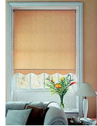
el estor штора