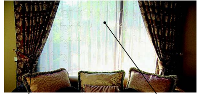
la cortina портьера