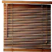
el estor de láminas жалюзи