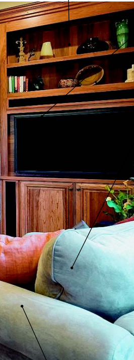
el armario сервант