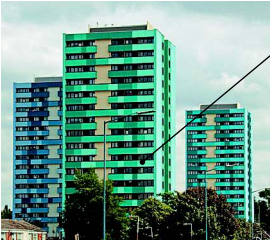
el edificio многоквартирный дом