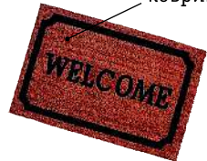
el felpudo коврик