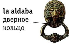
la aldaba дверное кольцо