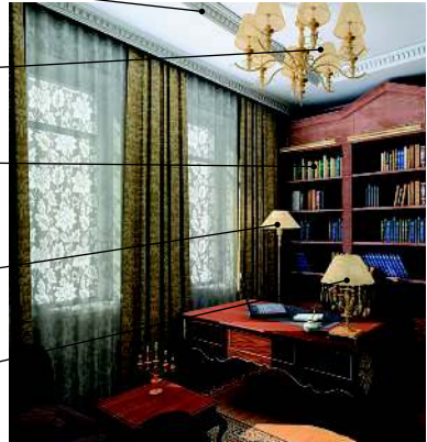
el despacho кабинет