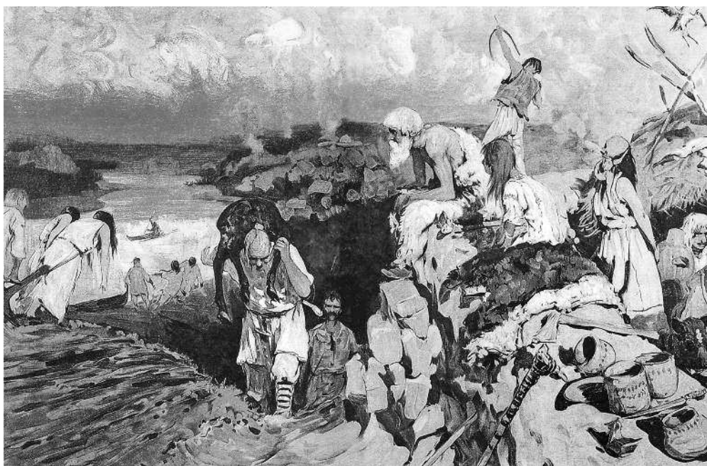
С.В. Иванов. Сцена из жизни восточных славян

них был Перун, бог грома и молнии; — поклонялись также солнцу под разными именами (Дажбога, Волоса), огню, ветру. Верили в загробную жизнь, думали, что души умерших могут есть, пить, и потому считали обязанностью угощать их. Общественного богослужения, храмов, жрецов у них не было; старшины или родоначальники были и жрецами, приносили жертвы.