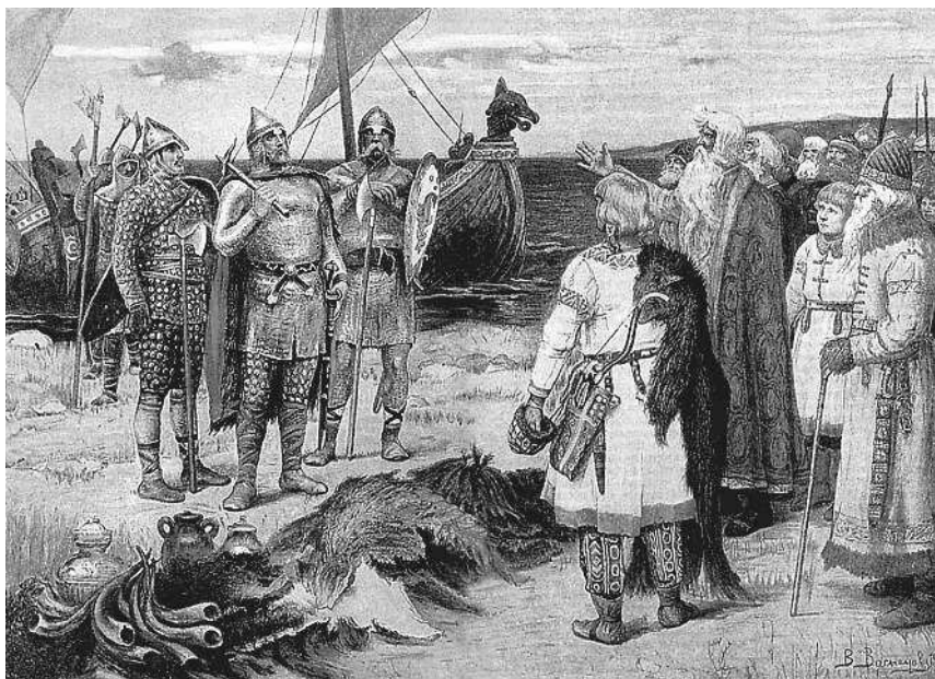
В.М. Васнецов. Варяги

В то время, когда южные славянские племена платили дань козарам, северные не могли защищаться от норманнов, жителей Швеции, Норвегии и Дании, которых славяне называли варягами и русью. Эти варяги покорили себе славян северных, живших в нынешних Новгородской и Псковской губерниях, покорили также соседние финские племена. Через несколько времени племена эти, как славянские, так и финские, собрались вместе и выгнали варягов, но когда после этого стали управляться сами, то никак не могли мирно улаживаться; опять каждый род стал жить отдельно и силою разделяваться с другими родами. Тогда племена собрались и сказали: «Поищем себе князя, который бы владел нами и судил по праву». Порешивши так, послали они за море к варягам-руси сказать им: «Земля наша велика и обильна, а порядка в ней нет: приходите княжить и владеть нами». На этот зов в 862 году собрались три князя варяго-русских, три брата — Рюрик, Синеус и Трувор и пришли с родными своими. Рюрик утвердился в Новгороде, у славян, живших по Ильменю; Синеус — среди финского племени на Белоозере; Трувор — у славян, живших в нынешней Псковской губернии, в городе Изборске. Скоро Синеус и Трувор умерли, и Рюрик стал княжить один;