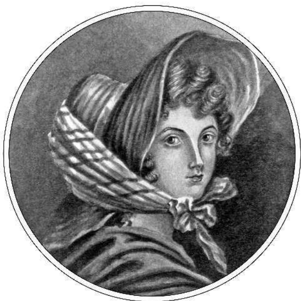
Эмили БРОНТЕ (1818-1848)