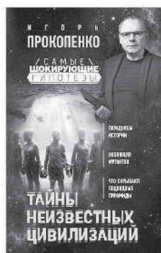
ТАЙНЫ НЕИЗВЕСТНЫХ ЦИВИЛИЗАЦИЙ