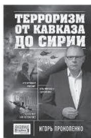
ТЕРРОРИЗМ ОТ КАВКАЗА ДО СИРИИ