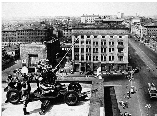
Зенитчики обороняют небо столицы.

Битва за Москву (Московская битва, Битва под Москвой; 30 сентября 1941-го – 20 апреля 1942 года) делится на 2 периода: оборонительный (30 сентября – 4 декабря 1941-го) и наступательный, который состоит из 2 этапов: контрнаступления (5–6 декабря 1941-го – 7–8 января 1942-го) и общего наступления советских войск (7–10 января – 20 апреля 1942-го). В ходе Московской оборонительной операции были проведены Орловско-Брянская, Вяземская, Можайско-Малоярославцевская, Калининская, Тульская, Клинско-Солнечногорская и Наро-Фоминская фронтовые оборонительные операции.