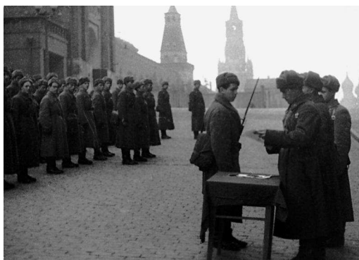
Бойцы принимают присягу на Красной площади. Июль 1941 г.