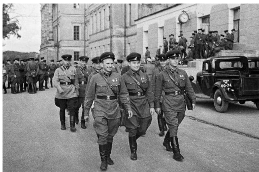
Выпускники Военной Академии им. Сталина. Москва, июнь 1941 года.

На Брянском фронте немцы устремились к Орлу. Командующий 2-й танковой бригады Гудериан напишет в своих воспоминаниях: «2 октября... одновременно в районе действий 24-го танкового корпуса у Мценска, северо-восточнее Орла, развернулись ожесточенные бои, в которые втянулась 4-я танковая дивизия... В бой было брошено большое количество русских танков Т-34, причинивших большие потери нашим танкам. Превосходство материальной части наших танковых сил, имевшее место до сих пор, было отныне потеряно и теперь перешло к противнику. Тем самым исчезли перспективы на быстрый и непрерывный успех... Намеченное быстрое наступление на Тулу пришлось отложить». Однако Брянский фронт оказался рассеченным, и его войска, неся потери, с боями отступали на восток.