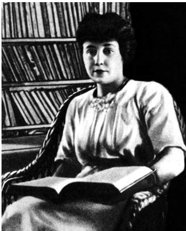
Марина Цветаева. Фотография 1913 года. Москва