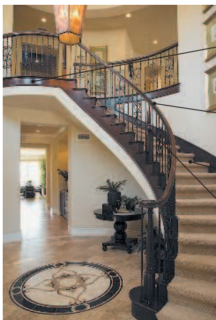
landing лестничная площадка