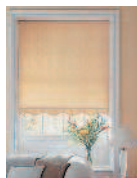
roller blind штора