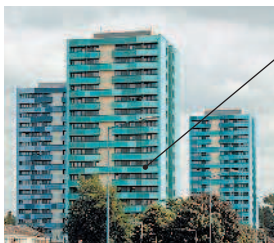
block of flats многоквартирный дом