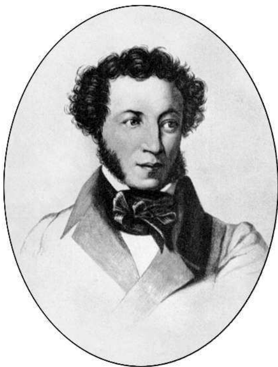
А. С. Пушкин. Гравюра Т. Райта. 1836—1837 гг.