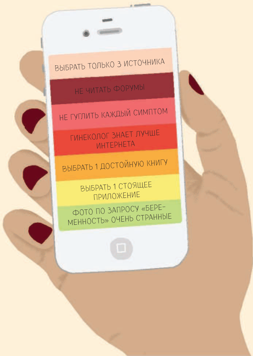
ФОТО ПО ЗАПРОСУ «БЕРЕ- МЕННОСТЬ» ОЧЕНЬ СТРАННЫЕ