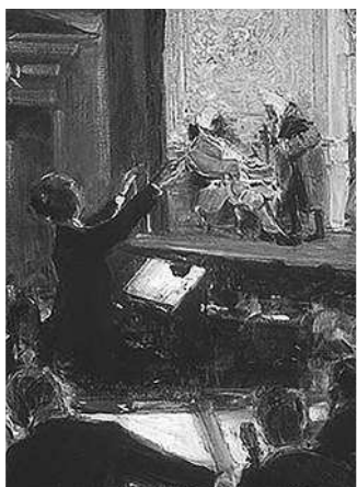
Исполнение оперы Рихарда Штрауса «Кавалер розы»