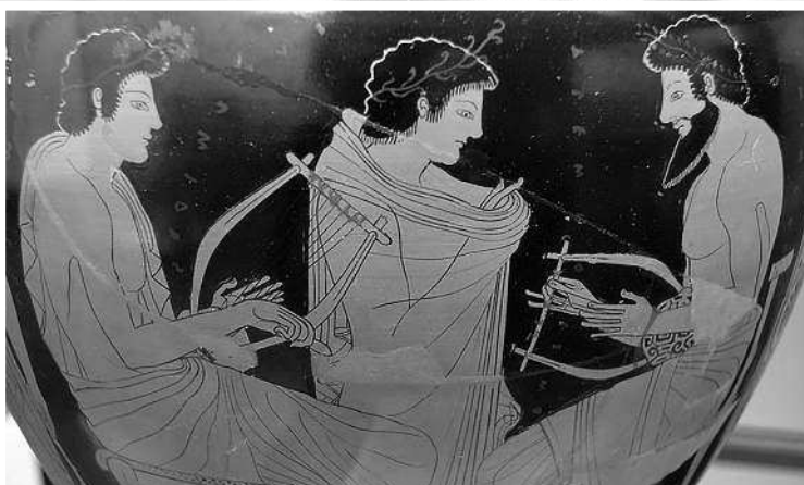
Рисунок на древнегреческой вазе: урок музыки