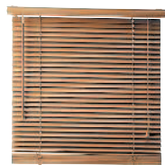
die Jalousie жалюзи