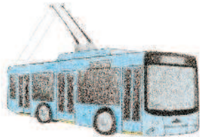
trolley bus троллейбус