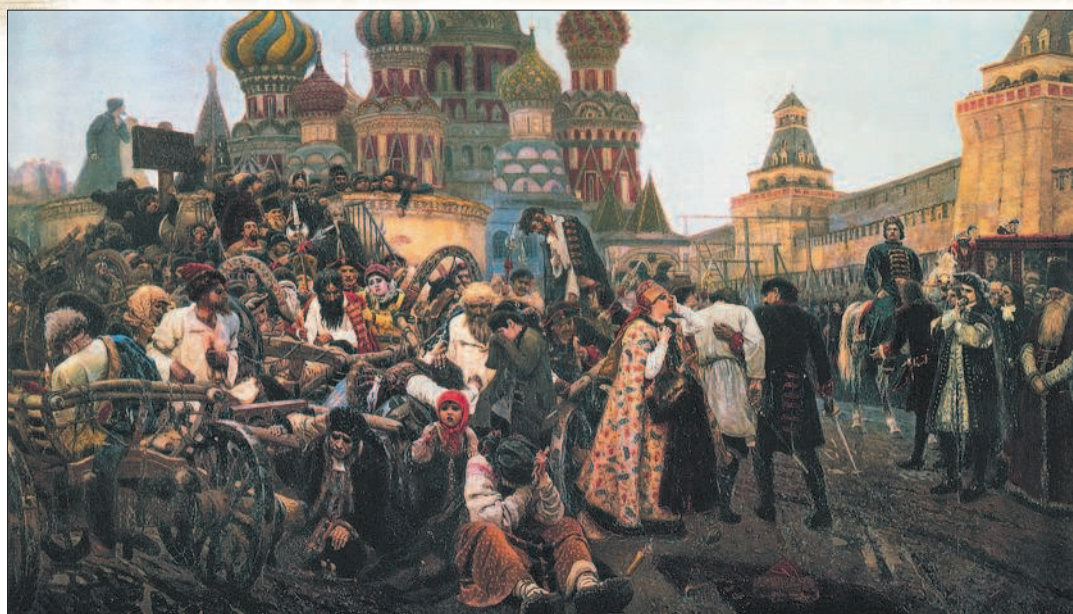
Утро стрелецкой казни. Художник В. Суриков

ского платья: дворянству указано было сменить долгополые одежды на короткие европейские кафтаны. Указом от 20 декабря 1699 г. с 1700 г. изменялся порядок отечественного летоисчисления. Отныне отсчёт приказано вести не от Сотворения мира, а, как в Европе, от Рождества Христова. При этом новолетие наступало не 1 сентября, а 1 января.