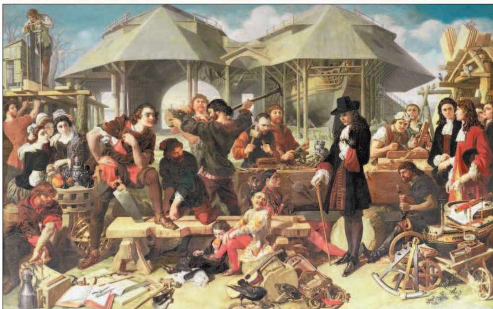
Пётр I в Голландии. Художник Д. Маклиз

морского снаряжения, оружия, научных приборов, обучение новым профессиям. Была и ещё одна важная цель — дипломатическая: «оживить» антитурецкий союз. Дело в том, что в Европе назревал новый конфликт — Война за испанское наследство. Союзники Петра, добившись перелома в борьбе с Турцией, теперь тяготились войной и склонялись к заключению сепаратного мира. Пётр, однако, ещё надеялся, что ему удастся восстановить антитурецкую коалицию.