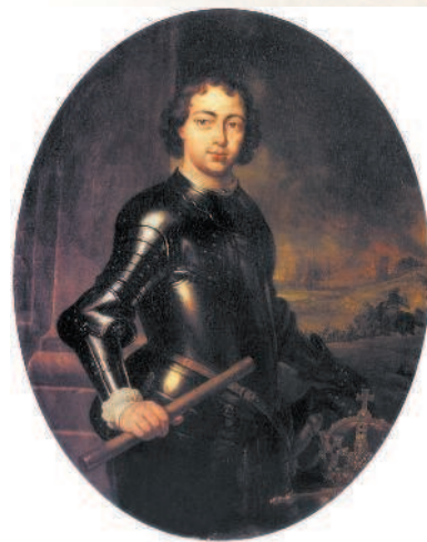
Царь Пётр I. Художник Я. Венникс

Фёдор Алексеевич вступил на престол после отца, но рано скончался — в апреле 1682 г. в возрасте 20 лет. Надо сказать, что он заботился о своём сводном брате и крестнике Петре: именно по его инициативе началось обучение младшего царевича. Однако смерть царя Фёдора резко изменила течение жизни при дворе. Имевшие большую силу боярские «партии» при поддержке патриарха Иоакима предпочли остановить свой выбор на царевиче Петре в обход старшего царевича Ивана. Основанием стали болезненность и слабоумие Ивана. Решение бояр было нарушением традиций престолонаследия, чем вскоре и воспользовались противники Нарышкиных. Девятилетний Пётр I был провозглашён царём. Однако его «единовластие» длилось недолго. Возмущение стрельцов 15 мая 1682 г., за которым стояла царевна Софья Алексеевна, привело к государственному перевороту. Власть была захвачена «партией» царевны Софьи . Странники Петра I потерпели поражение и принуждены были смириться с произошедшим. Пётр Алексеевич, правда, царём остался, но считался лишь «младшим» соправителем «старшего царя» Ивана Алексеевича. Правителем-регентом при братьях стала их старшая сестра Софья.