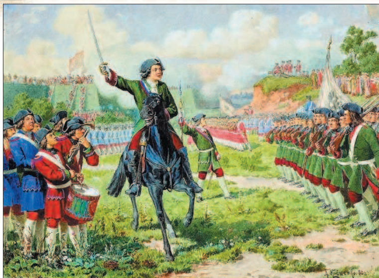
Военные игры потешных войск Петра I под селом Кожуховом. Художник А. Кившенко

нулся к прерванным «потехам». Со временем оказалось, что военные игры царя были больше, чем просто игры.