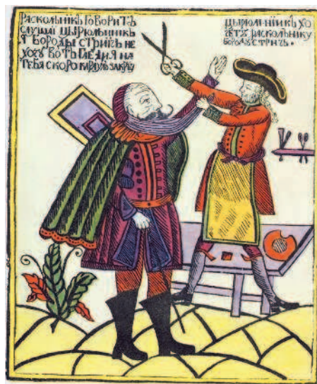
Указ о бритве бород. Лубок

В Москве царь сразу же принялся вводить «чужеземные обычаи с манера немецкого». Чувствовалось, что молодой государь не имеет ни чёткого представления о преобразовании страны, ни плана реформ . Видимо, им больше двигало желание поскорее сделать Россию хотя бы внешне похожей на Европу. Начал он с боярских бород, которые стали для Петра символом косной старины. Первые бороды Пётр отрезал собственноручно. Затем наступил черёд для рус-