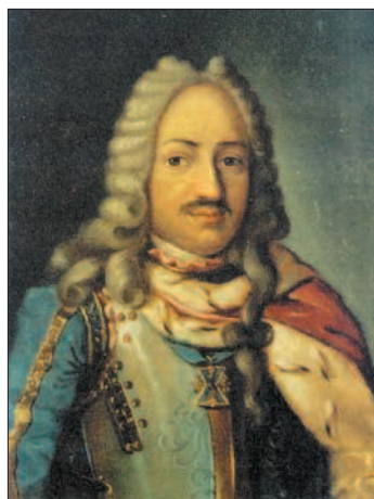
Ф. Лефорт. Неизвестный художник

Победа не «образумила» Петра. Устранив опасность со стороны соправительницы, он вер-