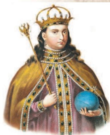
Царевна Софья Алексеевна