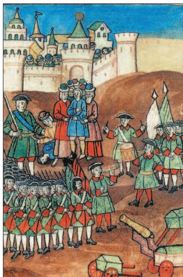
Взятие Азовской крепости. Миниатюра

«Марсовы и Нептуновы потехи» Петра I сформировали круг его пристрастий. Это морское (судостроение), артиллерийское и военное дело. Существует даже соблазн упрекнуть Петра в слишком затянувшейся страсти к «потехам». Но это было бы несправедливо. Нельзя забывать, что из петровских «забав» выросли многие преобразования. Игра в «потешных» оказалась неразрывно связана с военной