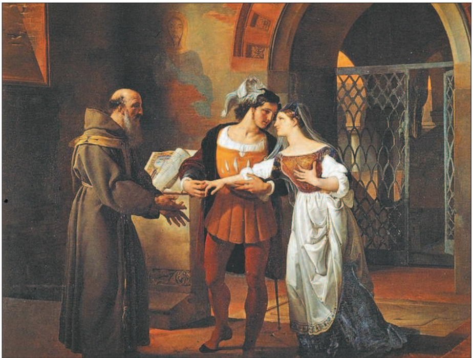
Ф. Айец. Ромео и Джульетта с братом Лоренцо

Как, спросите вы, увертюра? Ведь увертюрой только открывается опера или балет, а всё самое главное происходит дальше в нескольких актах?!