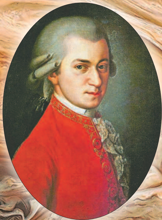
Б. Крафт. Портрет В.А. Моцарта

Таким сфотографировал поверхность планеты Юпитер космический корабль «Вояджер-1», на борту которого находится золотая пластинка с музыкой И.С. Баха. При желании можно уловить нечто общее в «партитуре» Юпитера и партитуре симфонии. Клянусь Юпитером, это неспроста!