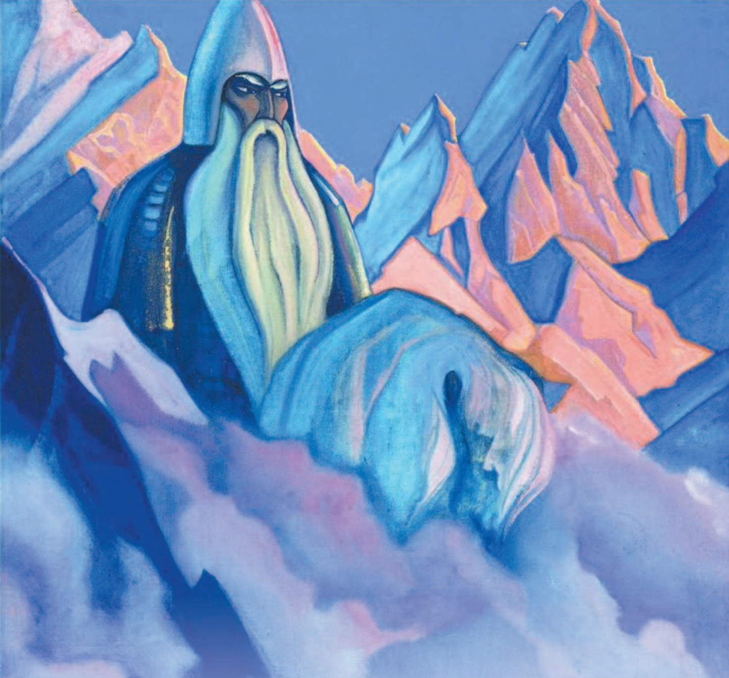
Святогор – в восточнославянской мифологии богатырь-великан, божественный и могучий – живет на высоких Святых горах Святогор. Н.К. Рерих. 1942. Частное собрание

ние славян по новым территориям, их верования менялись. Неудивительно, что многие боги обрели новые функции и облик, а подчас и получили другие имена. Однако основные черты славянской мифологии сохранились.