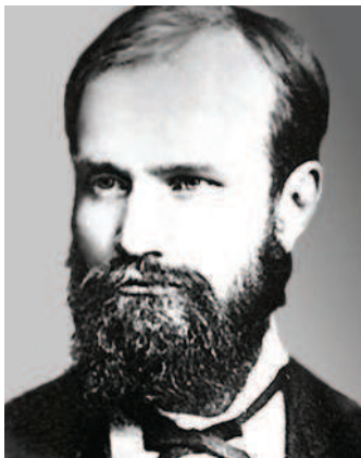
Иван Александрович Бодуэн де Куртенэ