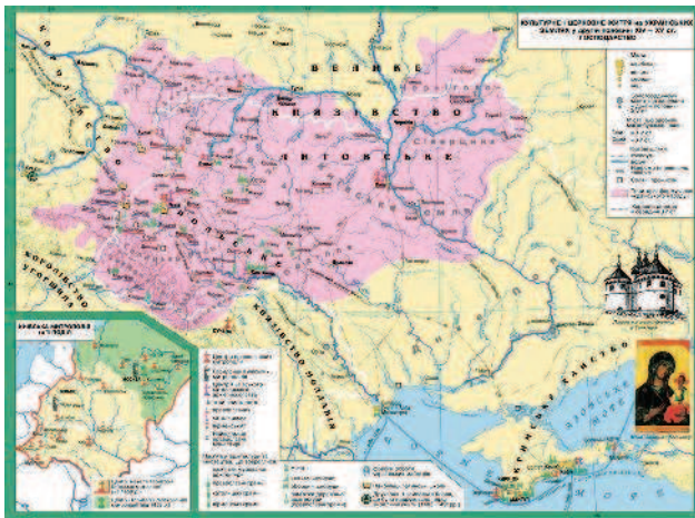
Украинская карта, воспроизводящая реальность, а не политическое безумие