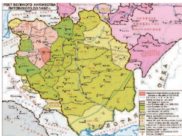
Рост Великого Княжества Литовского до 1462 года