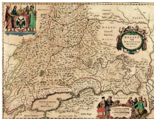
Космография Блау, Амстердам, 1645 год. Карта озаглавлена более чем ясно – Russia, в просторечии Moscovia. На ней в качестве «Russia» показана и Украина

Михалон Литвин; не сомневаются и итальянский историк Александр Гваньини (1538-1614), и польский – Матвей Стрыйковский (1547-1593). Знаменитый историк Цезарь Бароний (1538-1607) в своих «Церковных анналах» сообщает: «Московия получила свое наименование по названию реки и расположенной на ней столице, являясь частью Руси».