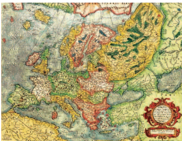
Карта Меркатора 1594 года. И здесь Белоруссия и Украина показаны как часть Russia