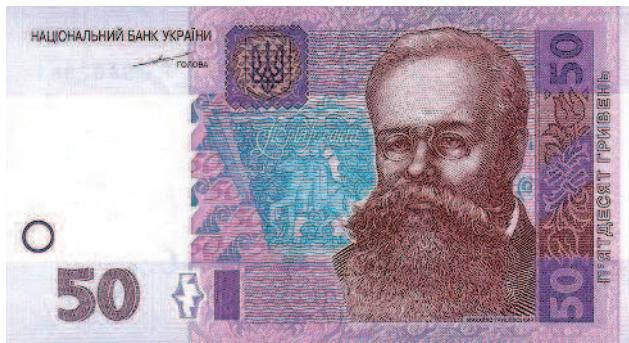
Украинская банкнота в 50 гривен 2004 года

Украина. Никаких варягов не было и быть не могло, Свендослав-Святослав и Хельг-Олег – украинские князья. Славяне жили на Украине искони веку, современные украинцы – единственные наследники Киевской Руси. Они и есть русы, русичи, русские.