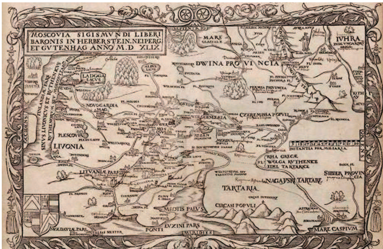
Карта Московии из книги Сигизмунда Герберштейна