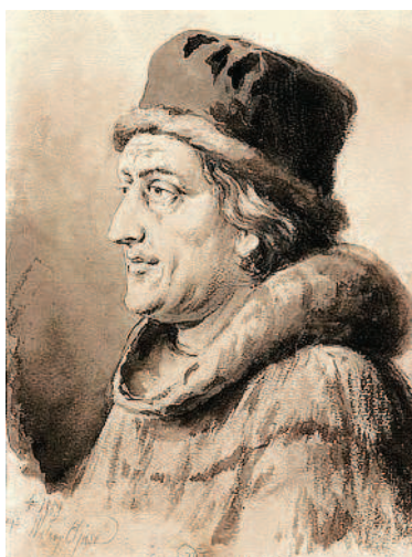
Воображаемый портрет Яна Длугоша. Элиаш- Радзиковский В., 1889 г.

С тех пор постоянно предпринимаются попытки придать слову «Московия» некий негативный смысл.