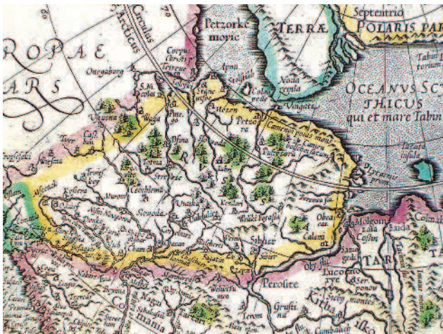
Карта Меркатора 1595 года. С точки зрения Меркатора, к востоку от Польши лежала Азия. Но частями России, как частями Азии, он показал и вся Восточную Украину и Крым – наверное, назло украинским националистам

Но конечно же некоторые французские историки приняли «теорию» Духинского – в том числе потому, что он поляк, «ему виднее».