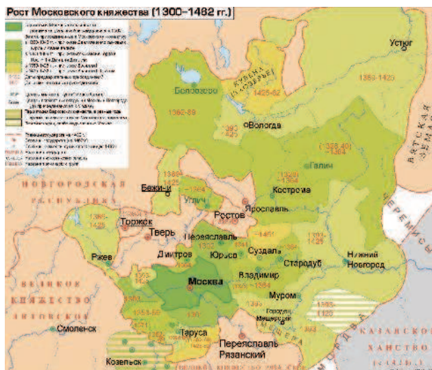
Рост Московского княжества с 1300 по 1462 годы

К концу XV века великое княжество Московское объединило территорию русского северо-востока. На этой территории сформировался народ, который правильнее всего называть великороссами. В названии нет претензий на некое историческое величие. Оно отражает только факт возникновения и существования народа на территории Великороссии – Великой, то есть Большой России. Это политическое объединение, Московское княжество, стало важнейшим центром объединения Руси, и новой геополитической реальности – Российской империи. Одновременно оно стало и национальным центром великороссов, и столицей географической реалии – Великороссии.