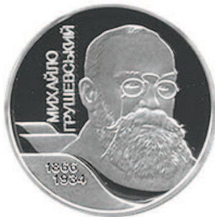
Памятная монета 2006 года

В феврале 2010 года сия дама попала в заголовки и стала широко обсуждаться после того как было опубликовано видео. В нем Ирина Фарион всерьез заявляет детям: «Никогда не будь Алёнкой. Если станешь Алёной, то нужно паковать чемоданы и выезжать в Московию». Дело в том, что девочка назвала себя Олэнкой – украинский вариант имени Елена, или Алена.