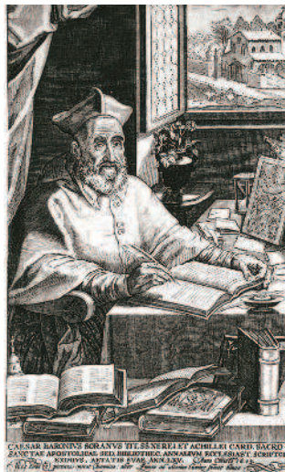
Портрет Цезаря Барония на фронтописе «Церковных анналов» (1624)

Когда Владимирское и Московское великое княжество окрепло, оно сразу же заявило о своих претензиях быть единственным собирателем русских земель. «Концепция централизованного государства круто замешана на московоцентризме» 7 . у ВКЛир и Польши возникло логичное стремление – закрепить само название «Русь» только за «своей» частью Руси 8 .