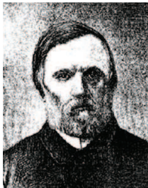
Продувная рожа Франциска Духинского

Отнюдь не приверженец официальных российских взглядов, сторонник культурной самостоятельности Польши и равноправия польского языка с русским, он не раз арестовывался властями Российской империи. Тем не менее в 1886 г. профессор Дерптского университета Бодуэн де Куртене издал в Кракове брошюру «Z powodu jubileuszu profesora Duchiskiego» («По поводу юбилея профессора Духинского»). В брошюре Бодуэн де Куртенэ отрицал за теорией Духинского всякое научное значение и признавал «празднование народом юбилея г. Духинского «юбилеем хронического патристического заблуждения».