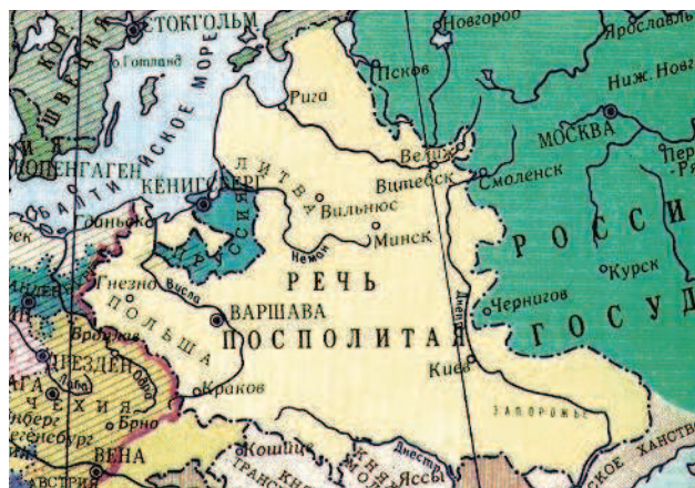
Речь Посполита в XVII веке

С XIII–XIV веков часть земель Руси оказалась в составе Великого княжества литовского, русского, жемайтов и иных (далее я буду называть его аббревиатурой ВКЛиР). Внесем полную ясность в вопрос: речь не идет о «захвате» русских земель некими внешними врагами. Таким образом изображали дело опять же в пропагандистской литературе, – даже в книгах, претендующих на научность. В духе: