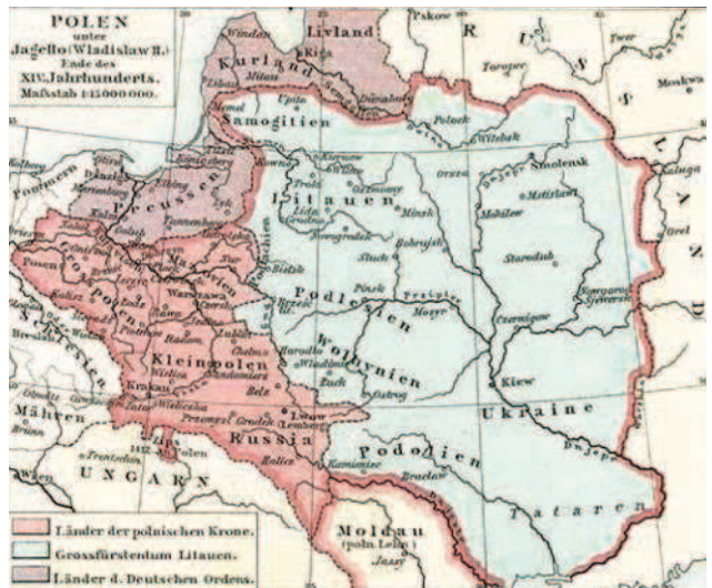
Авторам немецкой карты конца XIX века была известна разница между Украиной и Карпатской Русью в XIV веке

В этой книге я буду называть Московию – Московскую Русью. Просто чтобы не вызывать ненужных ассоциаций.