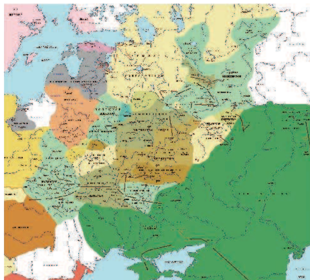
Русские княжества в конце XIII века

Сейчас учебных пособий известно очень много, позволю себе только одну цитату: «После татаро-монгольского нашествия на Русь литовцы сумели захватить