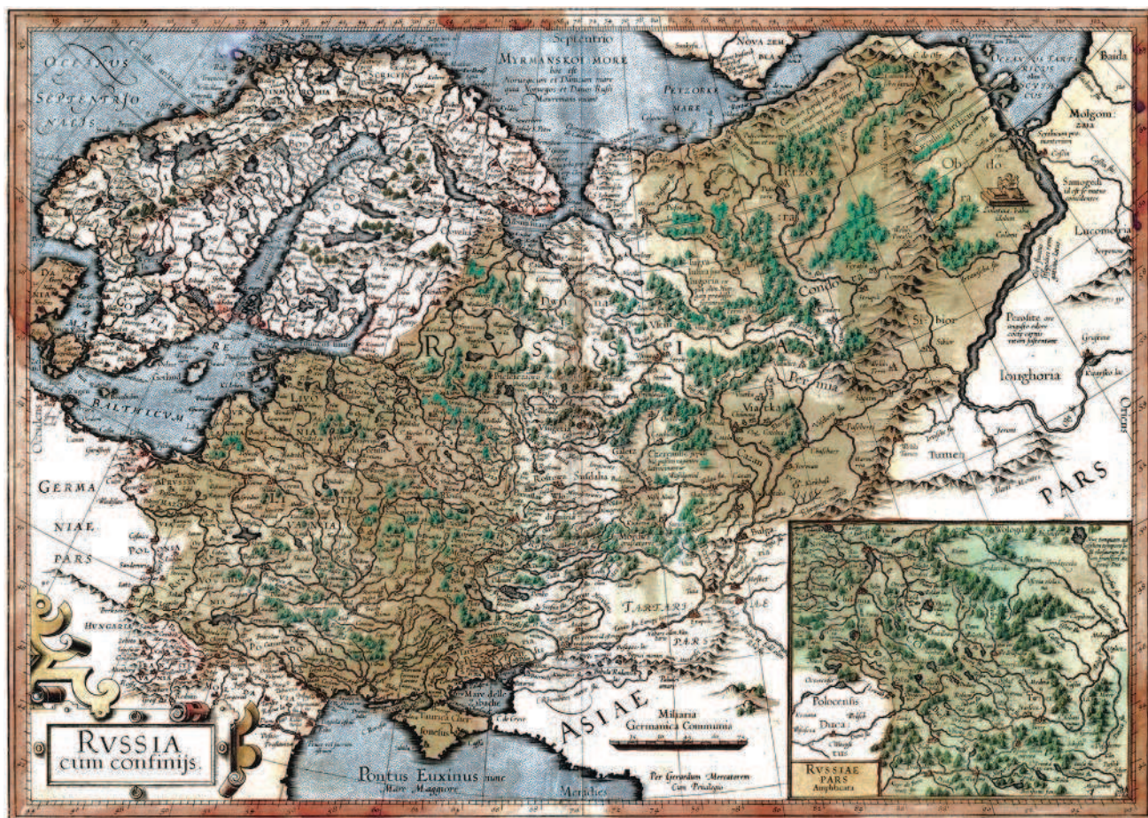
Карта Меркатора 1595 года

Справедливости ради, князья Владимирские точно так же отрицали право на русские