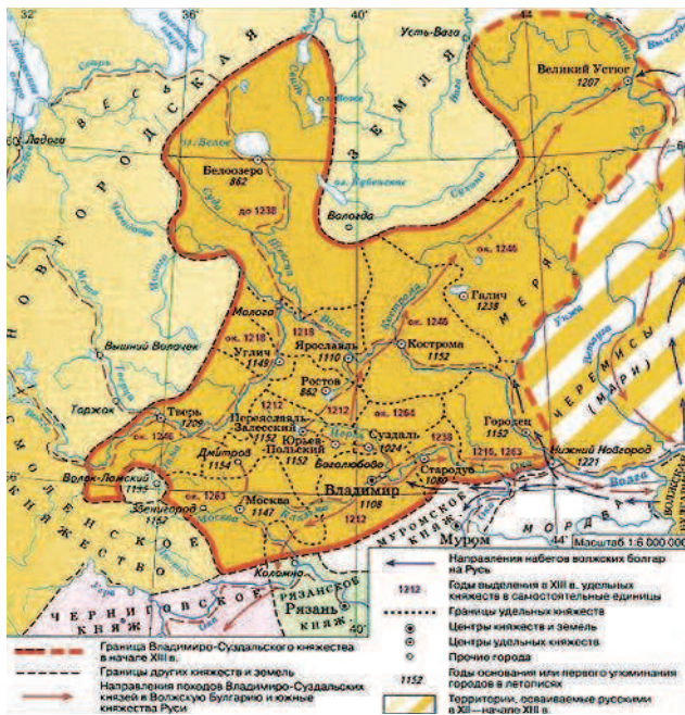
Владимирское княжество перед нашествием монголов

XIII веке Русь оказалась разделена между несколькими «центрами силы». Закарпатье присоединили венгры. Галицию – Польша. Польское и литовское правление действительно принимали многие русские земли, чтобы избавиться от монголов. Северо-восток Руси, Владимирское княжество, был самостоятельным «центром силы», хотя долго подчинялся монголам. Новгород и Псков вообще никому не подчинялись.