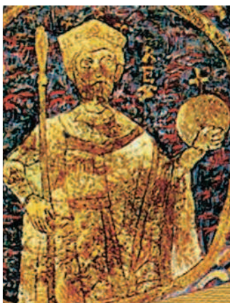
Король Иштван Святой (1000-1038) на средневековой миниатюре. Основатель государства, присоединившего Карпатскую Русь

Итак, мы имеем дело с исторической мифологией, на этот раз российской. Реальность в том, что после монгольского нашествия в