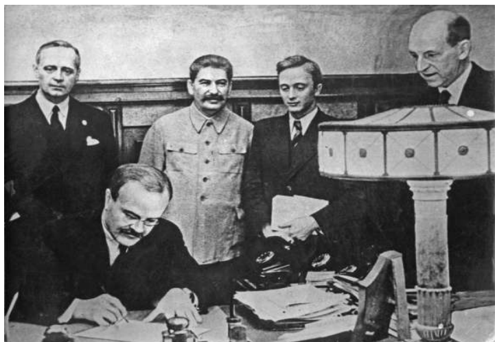
Подписание пакта Молотовым и Риббентропом

Небольшой приграничный город Белосток. Апрель 1941-го. Прошло уже почти два года с того самого дня, как немцы оккупировали Польшу, и потому тревога не покидает улочки городка. Люди запасаются мукой, солью, керосином. И готовятся к военному времени. Народ ничего не понимает в больших политических играх Советского Союза и Германии, но по вечерам все слушают новости из Москвы.