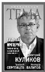
Дмитрий Куликов Судьба империи. Русский взгляд на европейскую цивилизацию