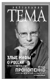
Игорь Прокопенко Злые мифы о России