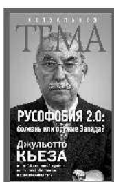
Джульетто Кьеза Русофобия 2.0: болезнь или оружие Запада?