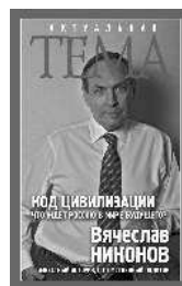
Вячеслав Никонов Код цивилизации. Что ждёт Россию в мире будущего?

Интернет-магазины издательства: https://book24.ru , http://www.labyrinth.ru/ В электронном виде книги издательства вы можете купить на www.litres.ru