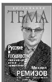
Михаил Ремизов Русские и государство. Национальная идея до и после «крымской весны»