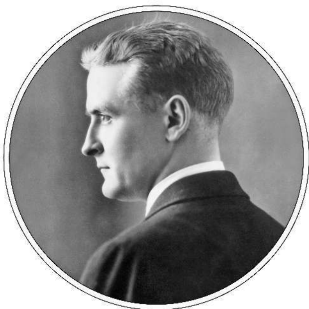
Франсис Скотт ФИЦДЖЕРАЛД (1896–1940)