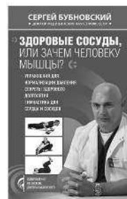
ЗДОРОВЫЕ СОСУДЫ, ИЛИ ЗАЧЕМ ЧЕЛОВЕКУ МЫШЦЫ?