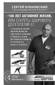
100 ЛЕТ АКТИВНОЙ ЖИЗНИ, ИЛИ СЕКРЕТЫ ЗДОРОВОГО ДОЛГОЛЕТИЯ