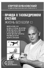
ПРАВДА О ТАЗОБЕДРЕННОМ СУСТАВЕ: ЖИЗНЬ БЕЗ БОЛИ