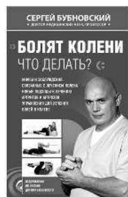
БОЛЯТ КОЛЕНИ. ЧТО ДЕЛАТЬ?