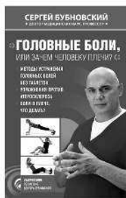
ГОЛОВНЫЕ БОЛИ, ИЛИ ЗАЧЕМ ЧЕЛОВЕКУ ПЛЕЧО?