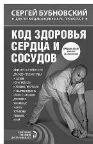
КОД ЗДОРОВЬЯ СЕРДЦА И СОСУДОВ