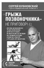
ГРЫЖА ПОЗВОНОЧНИКА – НЕ ПРИГОВОР!