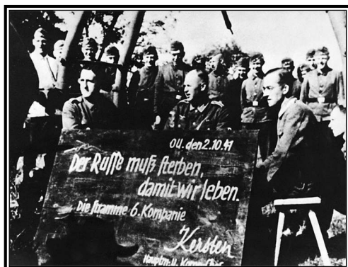
Вверху: В первые дни операции «Барбаросса», когда войска вермахта подходили к Москве, немцы были уверены в своей победе. Плакат, на котором указана дата — 2 октября 1941 г., — гласит: «Русские должны умереть, чтобы мы были живы».

Зицкриг превратился в блицкриг : французы были разбиты чуть больше, чем за месяц, и были вынуждены подписать унизительный договор о перемирии в том самом Компьенском лесу, в том же самом вагоне поезда, в котором когда-то просила мира Германская империя в конце Первой мировой войны. Весь мир облетели кадры киносъемки с Гитлером, танцующим от радости при известии о капитуляции Франции, и с немецкими солдатами, марширующими по Елисейским Полям. Великобритания, которую от врага защищал Ла-Манш, а также мастерство и