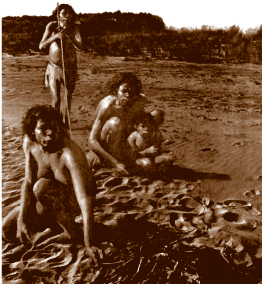
Троглодиты. Первобытные люди эпохи мезолита