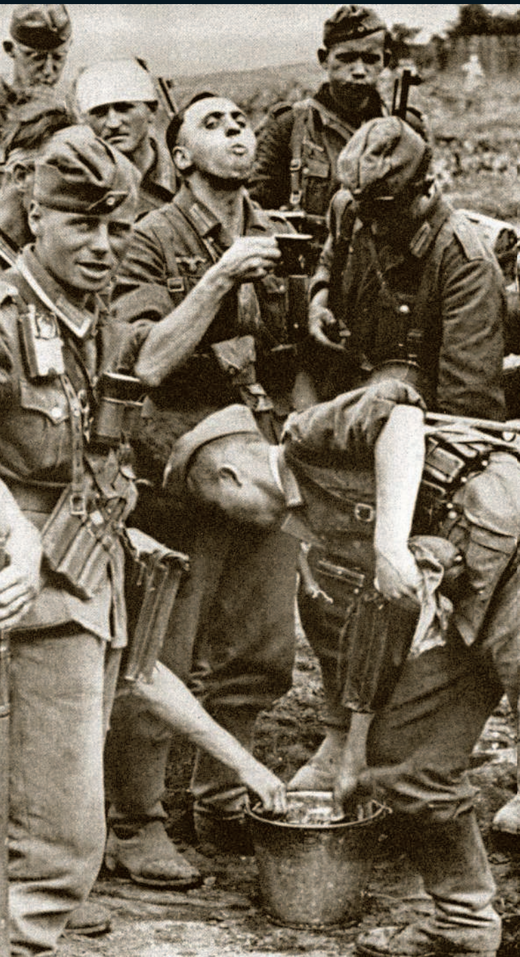
Глоток воды на пути к Сталинграду. Пехотинцам Вермахта предстояло прошагать многие километры по степи до первого боевого столкновения с войсками советских резервных армий

5 апреля 1942 года Гитлер подписал Директиву № 41, в которой были окончательно определены цели летней кампании на Восточном фронте: «Главная задача состоит в том, чтобы, сохраняя положение на центральном участке, на севере взять Ленинград и установить связь на суше с финнами, а на южном фланге фронта осуществить прорыв на Кавказ» . Первоначально план летнего наступления Вермахта получил кодовое наименование «Зигфрид», но вскоре название было изменено на «Блау» ( «Blau» — Синий ) и встало в один ряд с наименованием планов победоносных «блицкригов» против Польши в 1939 году ( «Weiß» — Белый ), Бельгии, Голландии, Люксембурга и Франции в 1940 году ( «Gelb» — Желтый ) и второй фазы Французской кампании, завершившейся парадом немецких войск на Елисейских Полях в Париже ( «Rot» — Красный ). Операция «Блау» должна была претворить в жизнь мечту фюрера — захват кавказских нефтепромыслов, который бы лишил Красную Армию «крови» современной механизированной войны.