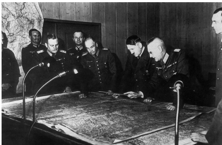
Разработка плана «Барбаросса»

Город-порт Тобрук, расположенный на побережье Средиземного моря, также был осажден немецкими войсками, которые не смогли овладеть им. При наступлении на территорию Советского Союза немцам менее всего хотелось наткнуться на такую преграду, которой, ввиду наличия коммуникаций со стороны моря, могла стать Одесса. В то же время немецкое командование считало, что на приморское направление, вследствие заинтересованности в нем Румынии, не следует бросать немецкие войска, которые нужны были на других участках советско-германского фрон-