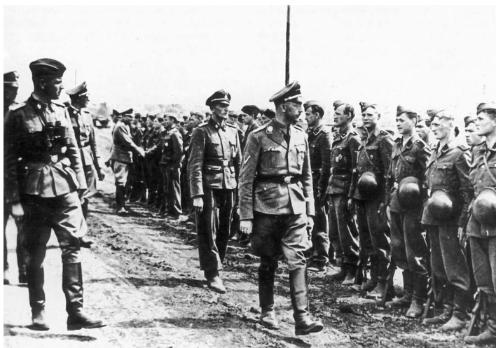
Г. Гимлер проводит смотр подчиненных войск

Командующий 9-й армией генерал Я. Т. Черевиченко решил обходиться своими силами и приказал левофланговой 150-й стрелковой дивизии частью сил