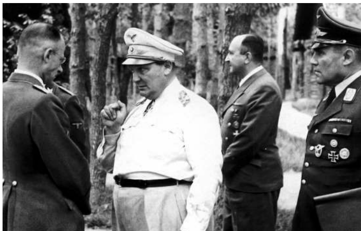
Г. Геринг ставит задачи авиации

Если сделать соответствующие расчеты соотношения сил и средств на основании этих данных, то получатся совершенно другие цифры. Можно говорить