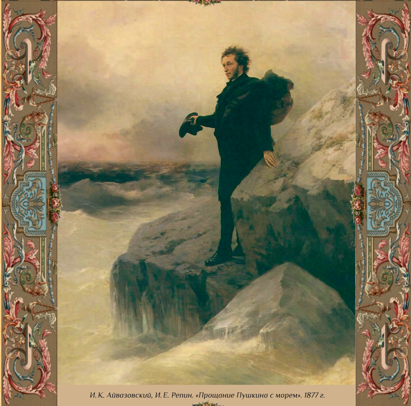
И. К. Айвазовский, И. Е. Репин. «Прощание Пушкина с морем». 1877 г.