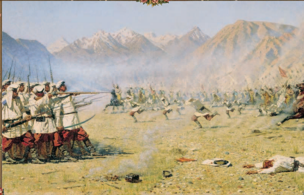
В. В. Верещагин. «Нападают врасплох». 1871 г.