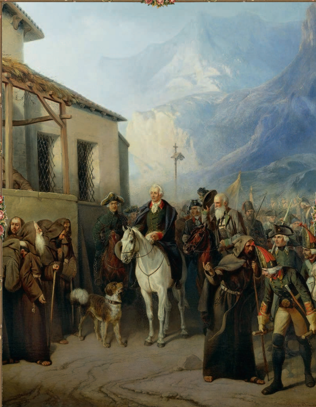
А. И. Шарлемань. «Фельдмаршал Суворов на вершине Сен-Готарда 13 сентября 1799 г.»