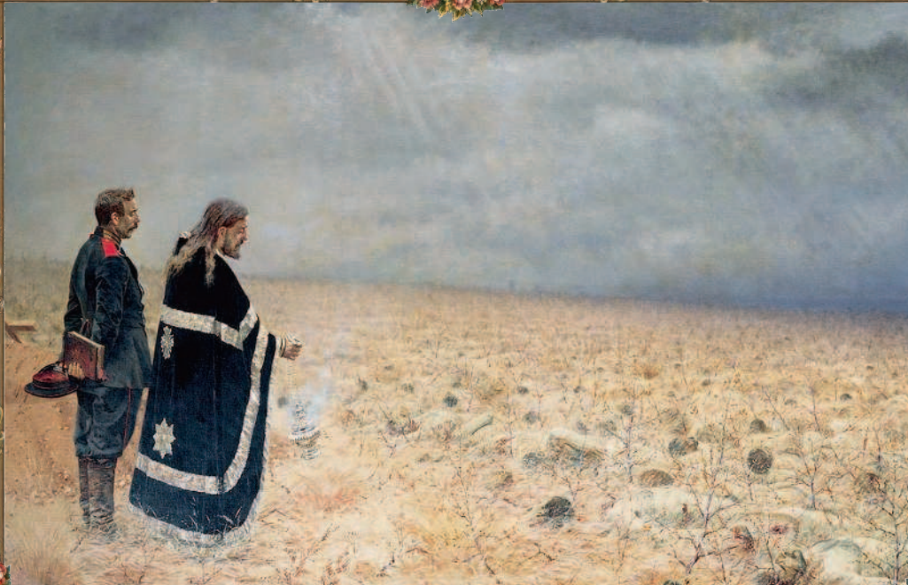
В. В. Верещагин. «Побежденные». 1877 г.