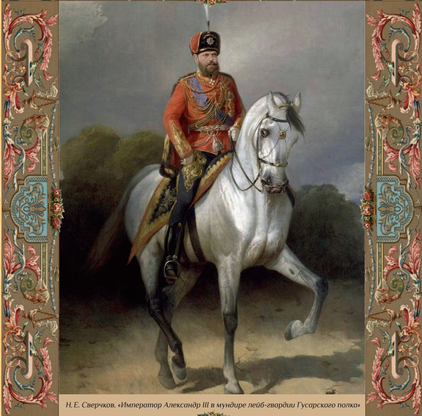
Н. Е. Сверчков. «Император Александр III в мундире лейб-гвардии Гусарского полка»