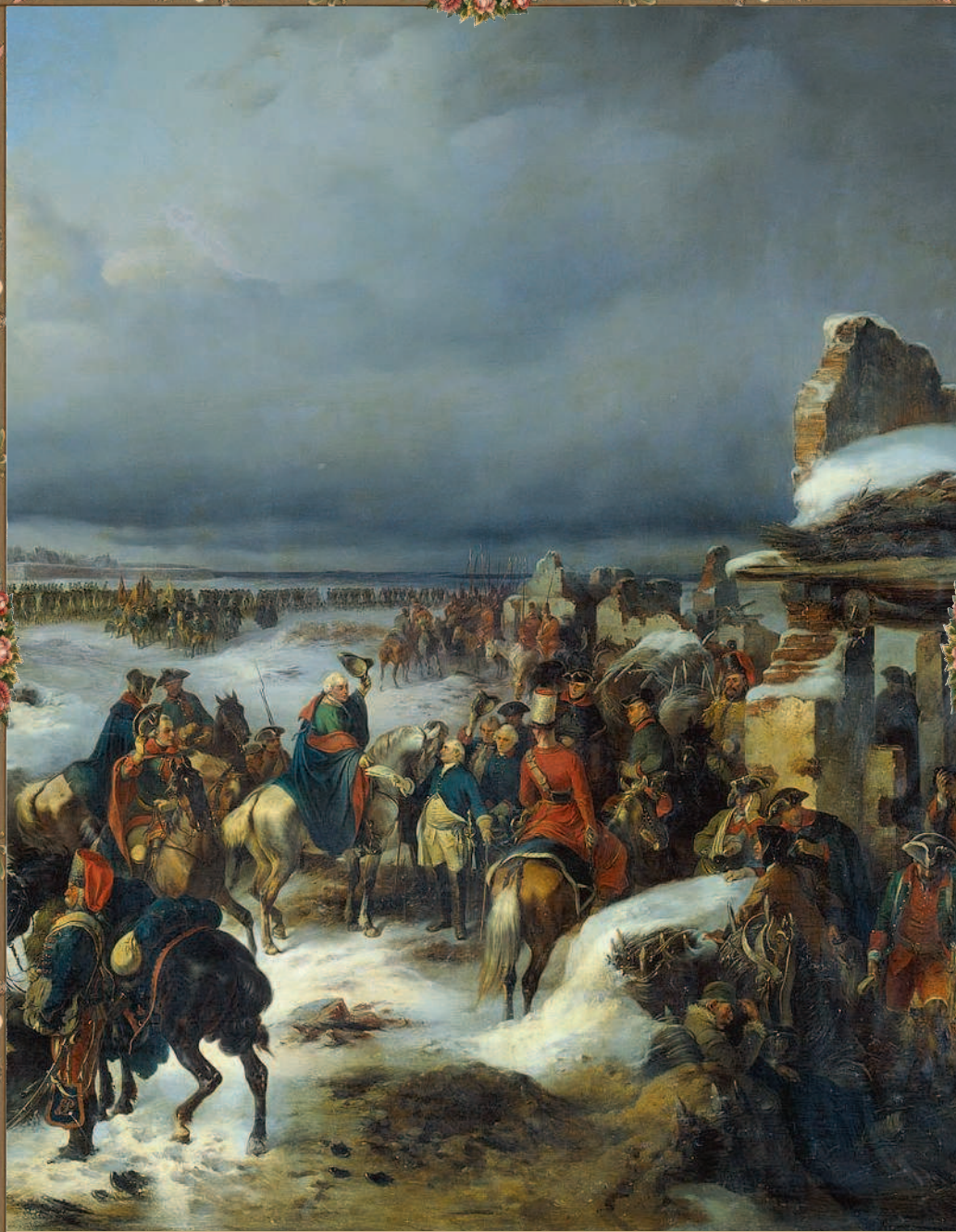
А. Е. Коцебу. «Взятие крепости Кольберг в ходе Семилетней войны». 1852 г.