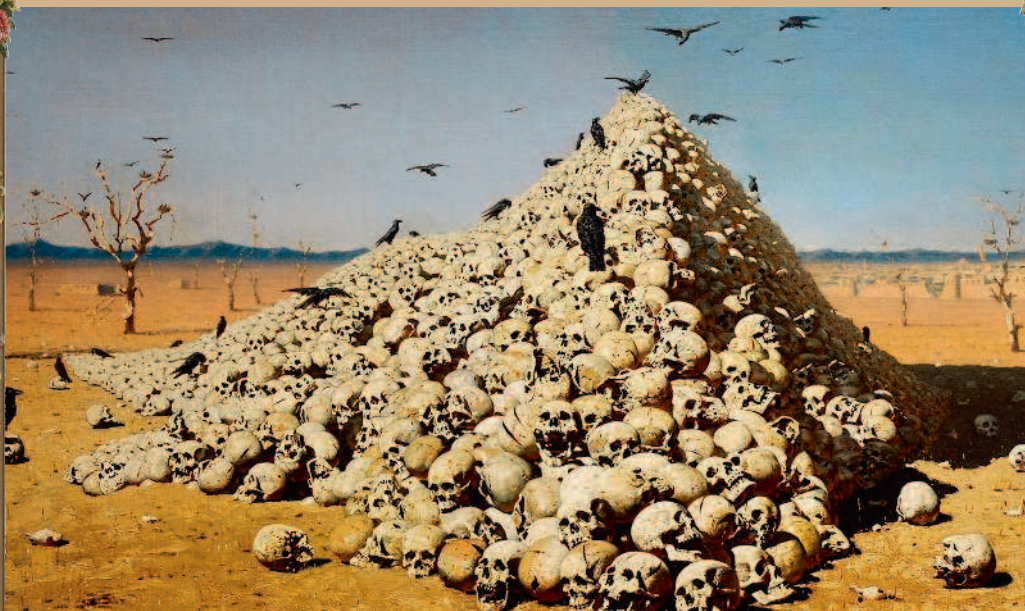
В. В. Верещагин. «Апофеоз войны». 1871 г.