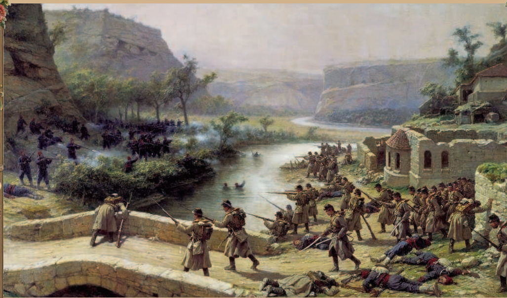
П. О. Ковалевский. «Бой у Иваново-Чифлик». 1887 г.