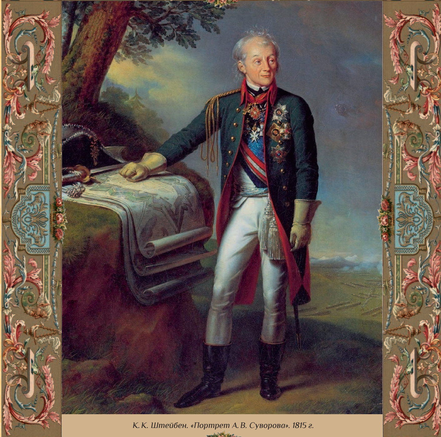
К. К. Штейбен. «Портрет А. В. Суворова». 1815 г.