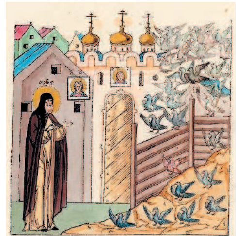
Как источник Карамзин использовал и жития святых и другую духовную литературу. Миниатюра из «Лицевого жития Сергия Радонежского», XVI в.

Вот материалы истории и предмет исторической критики!