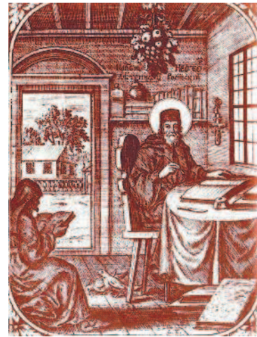
Первыми историками России были церковные летописцы

Благодаря всех, и живых и мертвых, коих ум, знания, таланты, искусство служили мне руководством, поручаю себя снисходительности добрых сограждан. Мы одно любим, одного желаем: любим отечество; желаем ему благоденствия еще более, нежели славы; желаем, да не изменится никогда твердое основание нашего величия; да правила мудрого самодержавия и святой веры более и более укрепляют союз частей; да цветет Россия... по крайней мере долго-долго, если на земле нет ничего бессмертного, кроме души человеческой!