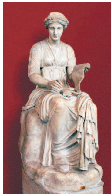
Клио – муза истории

Если всякая история, даже и неискусно писанная, бывает приятна, как говорит Плиний: тем более отечественная. Истинный космополит есть существо метафизическое или столь необыкновенное явление, что нет нужды говорить о нем, ни хвалить, ни осуждать его. Мы все граждане, в Европе и в Индии, в Мексике и в Абиссинии; личность каждого тесно связана с отечеством: любим его, ибо любим себя. Пусть греки, римляне пленяют воображение: они принадлежат к семейству рода человеческого и нам не чужие по своим добродетелям и слабостям, славе и бедствиям; но имя русское имеет для нас особенную прелесть: сердце мое еще сильнее бьется за Пожарского, нежели за Фемистокла или Сципиона. Всемирная история великими воспоминаниями украшает мир для ума, а российская украшает отечество, где живем и чувствуем. Сколь привлекательны берега Волхова, Днепра, Дона, когда знаем, что в глубокой древности на них происходило! Не только Новгород, Киев, Владимир, но и хижины Ельца, Козельска, Галича делаются любопытными памятниками и немые предметы — красноречивыми. Тени минувших столетий везде рисуют картины перед нами.