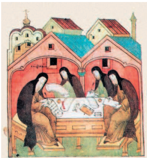
Большинство летописцев остались безымянными. Миниатюра Лицевого летописного свода, XVI в.

1. Летописи . Нестор, инок монастыря Киевопечерского, прозванный отцом российской истории, жил в XI веке 3 : одаренный умом любопытным, слушал со вниманием изустные предания древности, народные исторические сказки; видел памятники, могилы князей; беседовал с вельможами, старцами киевскими, путешественниками, жителями иных областей российских; читал византийские хроники, записки церковные 4 и сделался первым летописцем нашего отечества 5 . Второй , именем Василий, жил также в конце XI столетия: употребленный владимирским князем Давидом в переговорах с несчастным Васильком, описал нам великодушные последнего и другие современные деяния Юго-Западной России. Все иные летописцы остались для нас безыменными ; можно только угадывать, где и когда они жили: например, один в Новгороде, иерей, посвященный епископом Нифонтом в 1144 году; другой во Владимире-на-Клязьме при Всеволоде Великом; третий в Киеве, современник Рюрика II; чет-