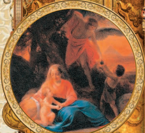
Отдых святого семейства на пути в Египет. Петр Пауль Рубенс. 1642–1643 гг.