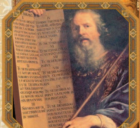
Моисей и Скрижали Завета. Филипп де Шампень. XVI в.