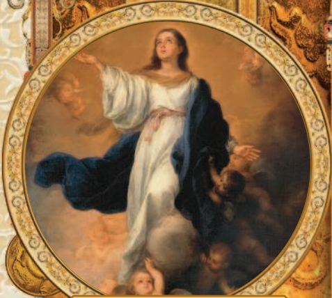
Непорочное зачатие. Бартоломе Эстебан Мурильо. 1670-е гг.