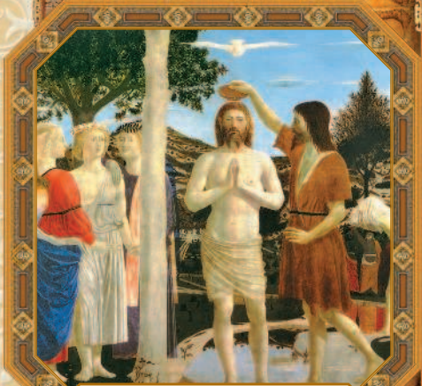
Крещение Христа. Пьеро делла Франческа. XV в.

И глупец, когда молчит, может показаться мудрым, и затворяющий уста свои — благоразумным.