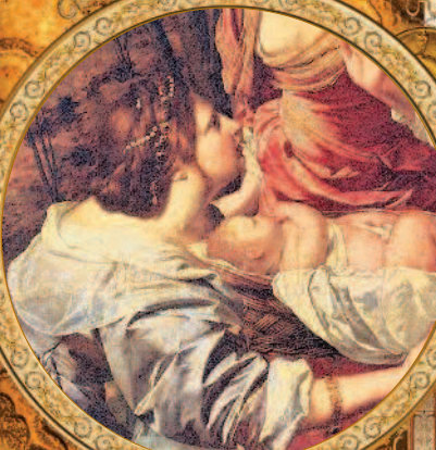
Моисея достают из Нила. Орацио Джентилески. XVII в. Фрагмент