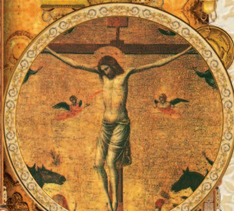
Распятие. Джотто ди Бондоне. XIV в.