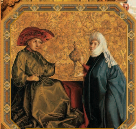
Царица Савская перед царем Соломоном. Конрад Виз. Ок. 1435 г.