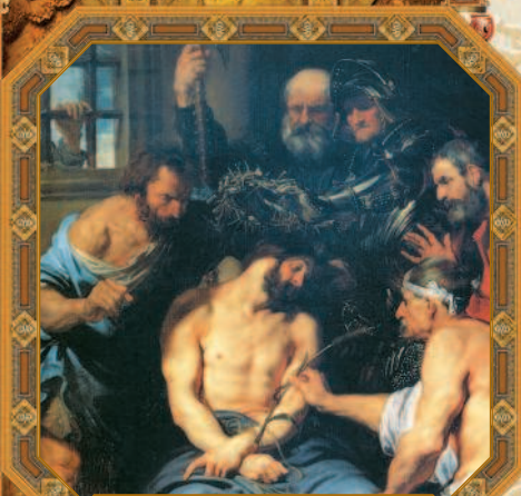
Венчание терновым венком. Антонис ван Дейк. XVII в.

Книга Екклесиаста, или Проповедника, 7, 5