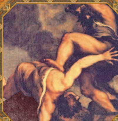
Кайн и Авель. Тициан Вечелио. XVI в.