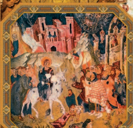
Вход Господень в Иерусалим. Фреска южного свода церкви Богородицы Пантанассы в Митре. 1428 г.

Книга Екклезиаста, или Проповедника, 1, 15