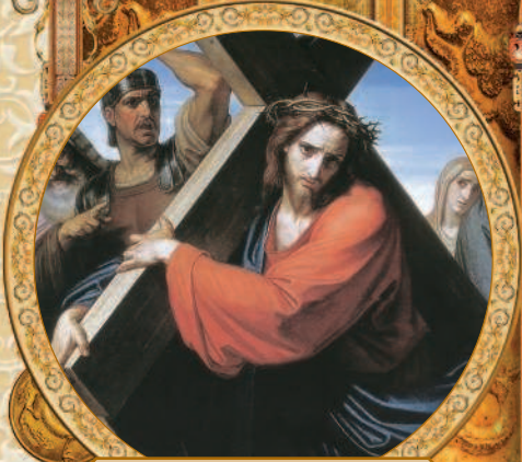
Несение креста. Федор Мюллер. 1869 г.