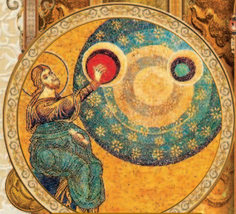
Сотворение неба и светил. Мозаика в соборе в Монреале. XII в.