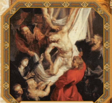
Снятие с креста. Питер Пауль Рубенс. 1612 г.