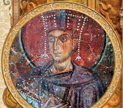
Царь Соломон. Фреска в Софии Новгородской. 1108–1109 гг.