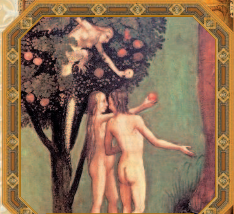
Грехопадение. Иероним Босх. XV в.

Во время сытости вспоминай о времени голода, и во дни богатства — о бедности и нужде.