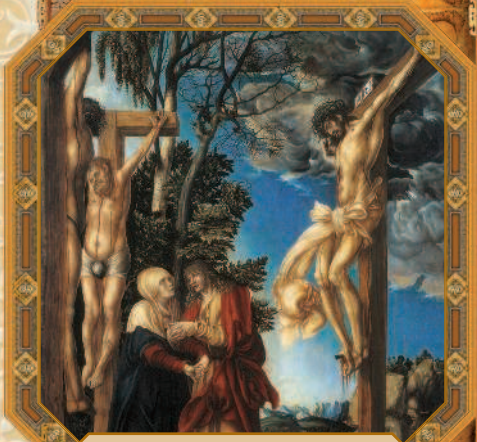
Голгофа. Лукас Кранах Старший. Ок. 1503 г.