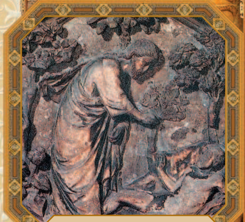
Сотворение Адама. Андреа Пизано. XV в.

Берегитесь лжепророков, которые приходят к вам в овечьей одежде, а внутри суть волки хищные.