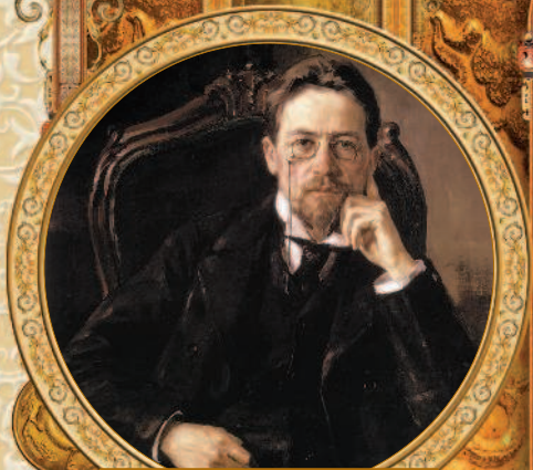
Портрет Антона Чехова. Осип Браз. 1898 г.