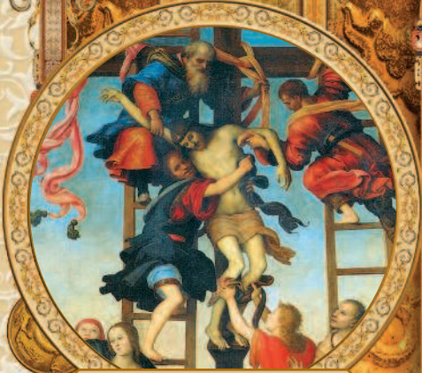
Снятие с креста. Пьетро Перуджино. XVI в.