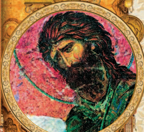
Иоанн Предтеча. Ангел Пустыни. Кон. VII в.