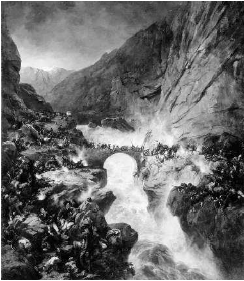
Переход через Чёртов мост.

Гравюра по рисунку А.Е. Коцебу. 1850-е гг.