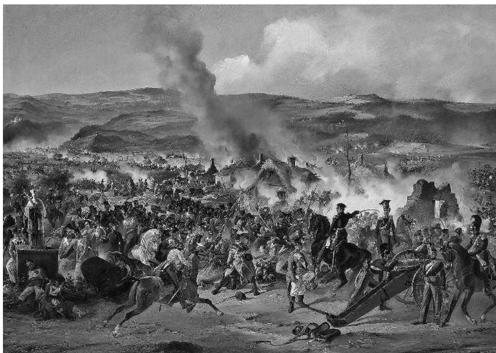
Пленение генерала Вандамма под Кульмом

Силы союзников стягивались под Лейпциг по частям. Первыми подошли Силезская армия фельдмаршала Блюхера и Богемская армия князя Шварценберга. В ходе сражения подтянулись Северная армия кронпринца Бернадотта (бывшего наполеоновского маршала), а также немалое количество иных войск. Всего союзная армия насчитывала более 300 000 человек, из которых 127 000 составляли русские, 89 000 — австрийцы, 72 000 — пруссаки и 18 000 — шведы.