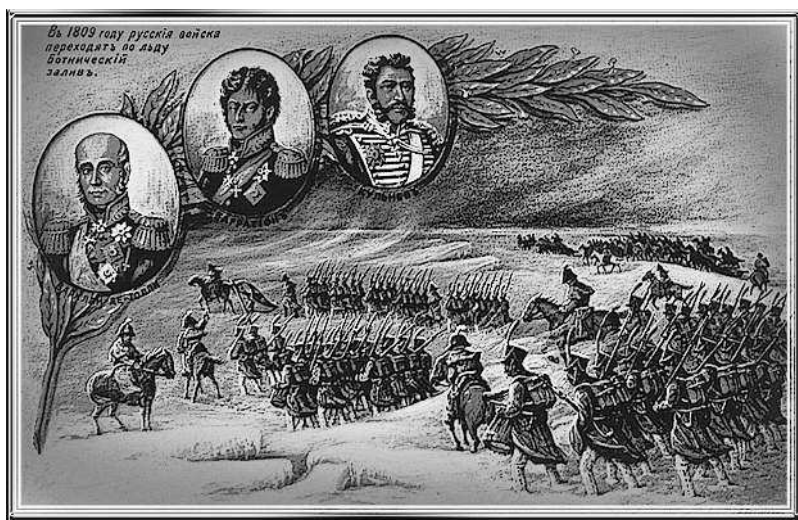
Переход русской армии через Ботнический залив

соединяясь на шведском берегу, должны были быстро проникнуть к Стокгольму».