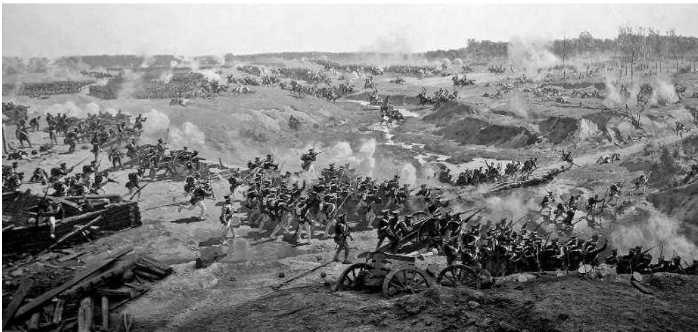
Бородинское сражение (фрагмент панорамы)

зов было сделано 60 000 пушечных выстрелов, с русской стороны — 50 000.