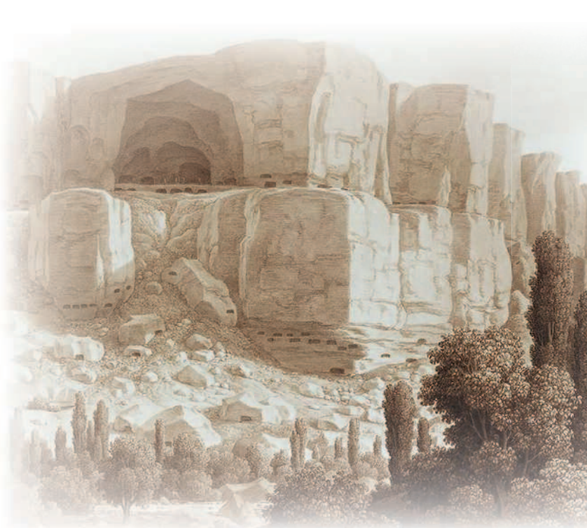
Вид пещерных скал близ Качи-Калена. Франц Герхардт фон Кюгельген. Серия «Пейзажи Крыма». 1824