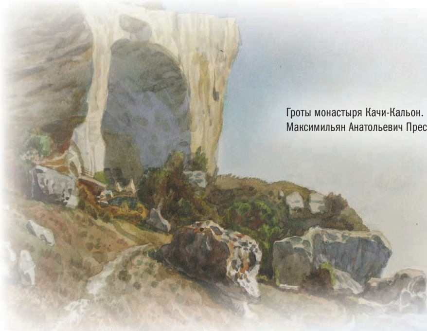
Гроты монастыря Качи-Кальон. Максимильян Анатольевич Пресняков. 2001

Тогда жители селения поняли, что место на скалах священное, и высекли в них храм. Так как явление Богородицы произошло 15 августа, в день празднования Успения Пресвятой Богородицы, храму дали имя в честь этого события. А место, где юноша впервые увидел икону, прозвали ущельем Святой Марии.