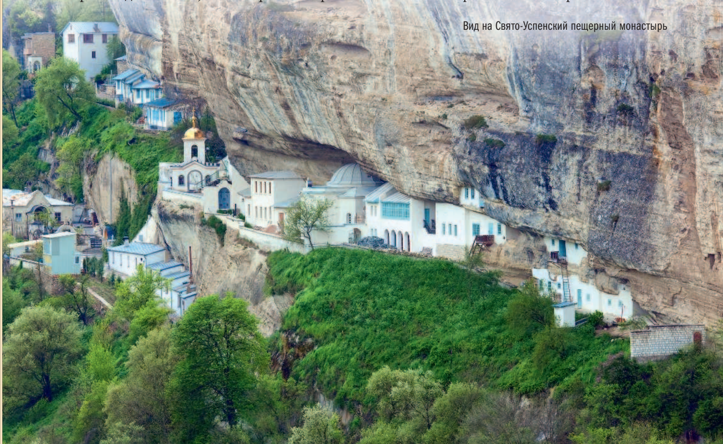
Вид на Свято-Успенский пещерный монастырь

превратился в военный госпиталь, потом был закрыт советскими властями, исполнял роль психоневрологического