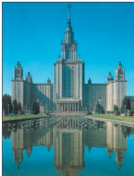
Здание Московского университета (Москва)

1. Как ты думаешь, имеют ли отношение к культуре представленные здесь фотографии? Обоснуй своё мнение.