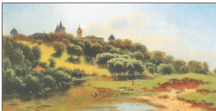
Л. Каменев. Вид на Саввино-Сторожевский монастырь