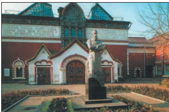
Третьяковская галерея (Москва)