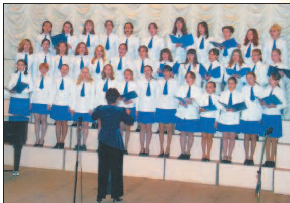
Выступление детского хора