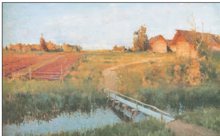
А. Шильдер. Село. Закат