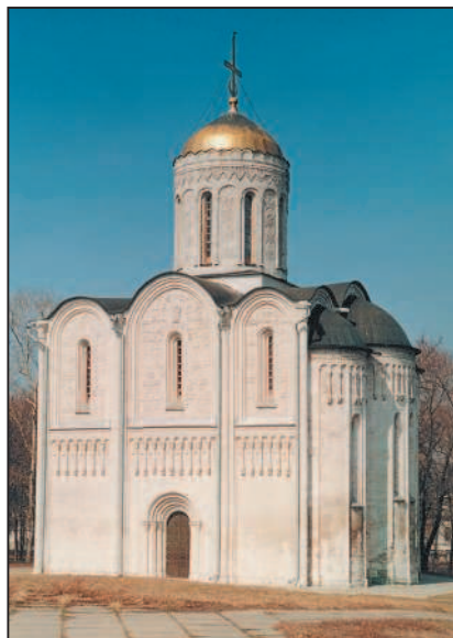
Дмитриевский собор (Владимир)

Орудия труда, предметы повседневной жизни, дома, церкви, крепости — всё это материальные ценности , или памятники культуры . Духовно-нравственная культура включает в себя мир идей и образов, которые создали писатели, живописцы, зодчие, учёные, а также нравственные ценности: взаимоотношения между людьми, чувства, религию.