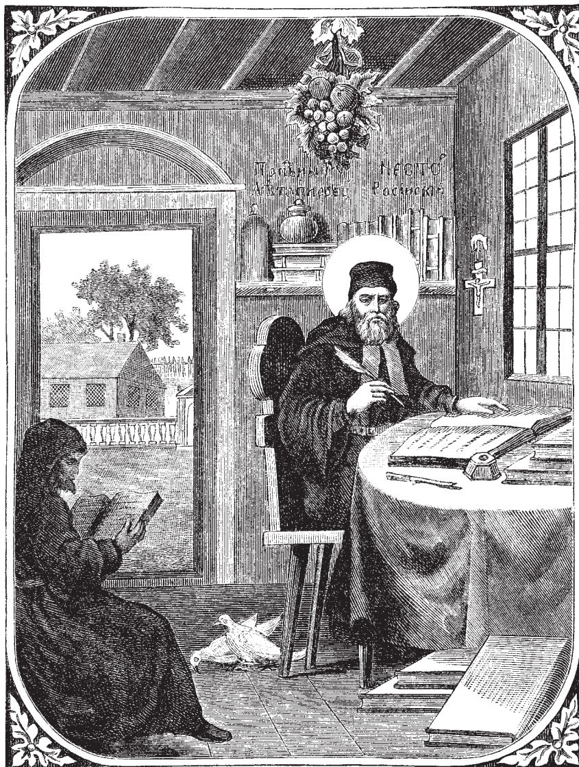
Преподобный Нестор Летописец. Миниатюра из книги «Патерик Печерский — сие есть Отечник». XVI в.