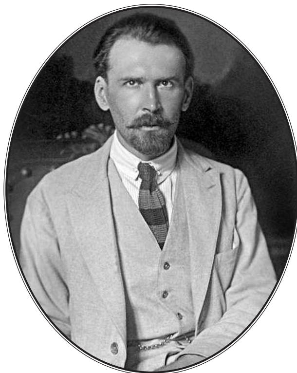
Николай Сергеевич ТРУБЕЦКОЙ 4 (16).04.1890 — 25.06.1938

Выдающийся русский ученый-языковед, историк, культуролог-философ, основатель теории евразийства, которая оказала существенное влияние на развитие общественной мысли России и русского зарубежья.